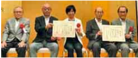
■八千代花と緑の応援団(写真左)…主に駅前ロータリーなどでバラの美化活動を行っています。■NPO法人八千代市植栽サポータークラブ(写真右)…主にゆりのき通りなどでツツジの美化活動を行っています。

これは、県が道路の美化や環境整備に大きく貢献した団体や個人を表彰するもので、2団体の長きに渡る活動が評価されました。