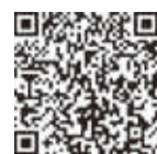
▲コロナワクチンについて

▼予約方法 市コールセンター☎0570(00)098かWEB申込フォームより。医療機関での直接予約も受け付けています。受付機関は市ホームページでご確認ください。