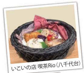
いこいの店 喫茶Rio(八千代台)