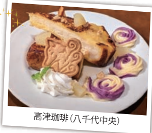
高津珈琲(八千代中央)