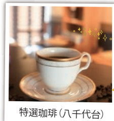
特選珈琲(八千代台)