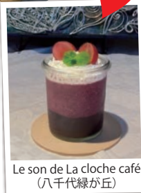
Le son de La cloche café (八千代緑が丘)