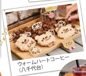
ウォームハートコーヒー (八千代台)