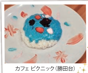
カフェピクニック(勝田台)