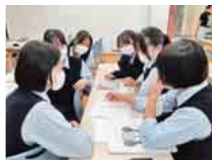
商品パッケージも高校生自ら考えました

すい「にじみる(にんじんみるくあいす)」となり、道の駅やちよと農業交流センターで、梨は、甘くて飲みやすい「梨のスムージー」となり、12月16日(土)の千葉英和高校のイベントで提供します。生徒たち