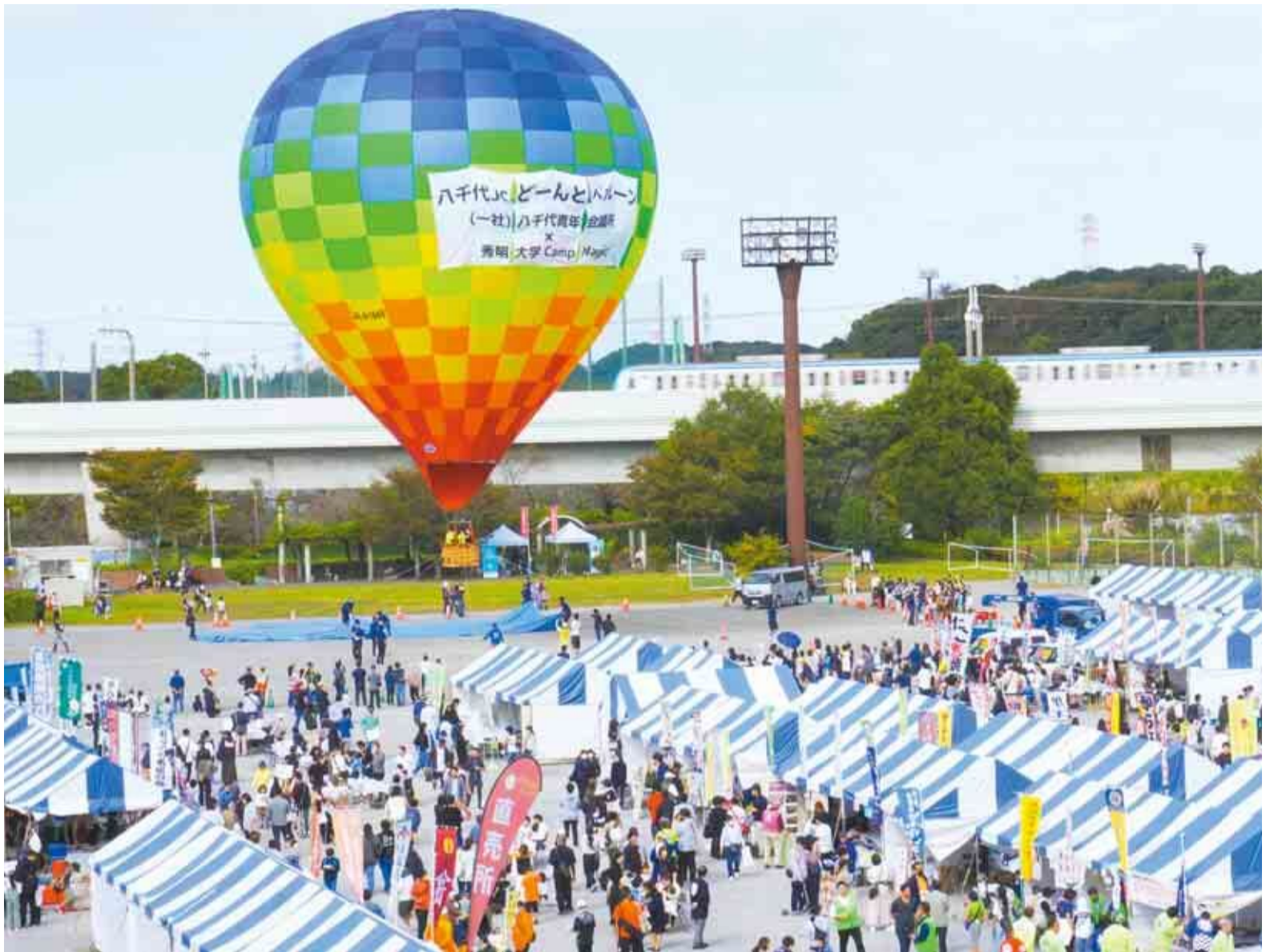
▲大勢の人で賑わう中、秋の青空に色鮮やかな気球が浮かび上がりました

商・工・農業に親しむ祭典「八千代どーんと祭」が10月21日、22日の2日間、八千代総合運動公園多目的広場で開催されました。