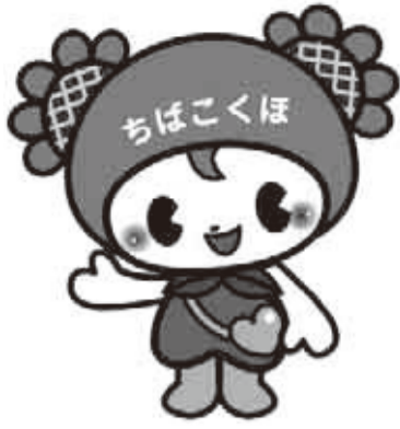
ちばこくほ マスコットキャラクター 「ちーこちゃん」