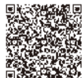
▲市民ギャラリーホームページ

▶対象 千葉県在住の小学生以上の人 ▶規格 A4(210mm×297mm)以上、A2(420mm×594mm)以内の平面作品 ▶募集期間 1月20日(土)必着。毎週月曜日(休館日)は受け取り不可。募集要項など詳しくは、市民ギャラリーなどで配布している応募用紙付きのチラシ、または市民ギャラリーホームページをご覧ください。