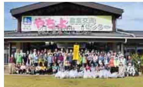
▲参加者の数も年々増え、仲良く夫婦で参加する人や久しぶりに顔を合わせた人もいました

今後もこうした地域貢献活動を通じて、高齢者の健康維持やコミュニティーづくりができるよう、活動を継続していきます。