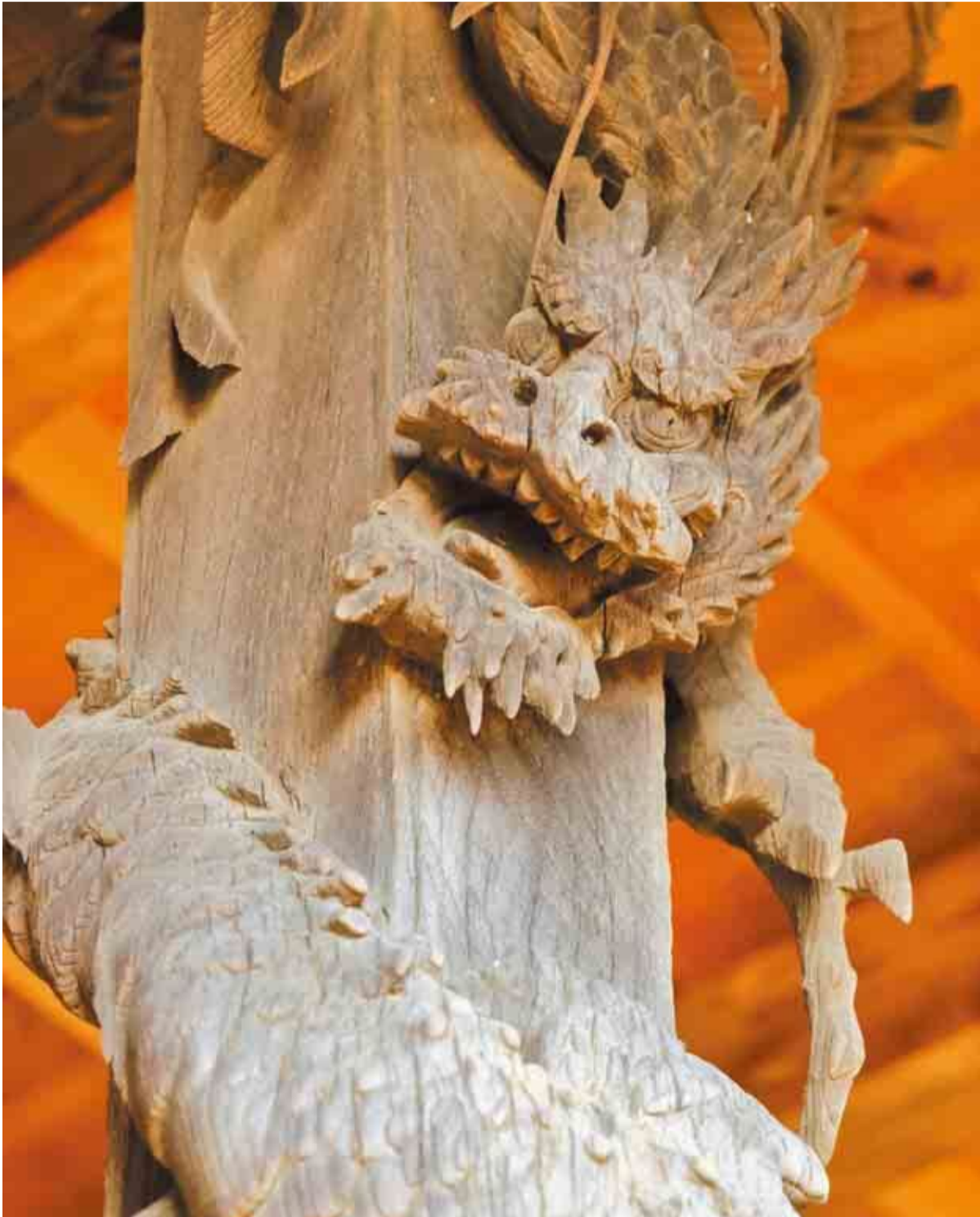
▲米本稻荷神社の柱に彫られた昇り竜。市内では、飯綱神社や萱田水神宮などに竜にまつわる言い伝えがあります

●八千代の人口 20万5,678人(+314人) 男 10万1,443人(+164人) 女 10万4,235人(+150人) ●八千代の世帯 9万6,730世帯(+221世帯) 11月末現在。( )内は前月比