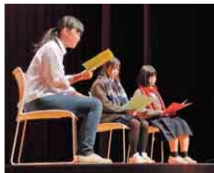
▲ガリバー旅行記を熟演する八千代高校の生徒たち

【日時】2月2日、9日、16日、23日いずれも金曜日午前9時～正午 【場所】市民体育館第一武道室 【料金】1,000円 【申し込み】1月19日(金)必着で往復はがきに返信先を記入の上、「住所・氏名(フリガナ)・年齢・電話番号・希望クラス」を明記し、市民体育館〒276-0043萱田1220へ郵送 【問い合わせ】市民体育館☎485-7200