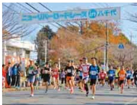
▲街並みと自然の両方が感じられます

冬晴れの下、5年12月3日に開催されたニューリバーロードレース in 八千代。大会当日は、市内外から2,838人のランナーが参加し、新川沿いの豊かな自然の中を走り抜けました。この大会は、10マイルをはじめ、5kmや2.5km親子ファンランなど、自分の体力に合わせた距離で走ることができるようさまざまな種目があります。次回はぜひ参加してみたいはいかがでしょうか。