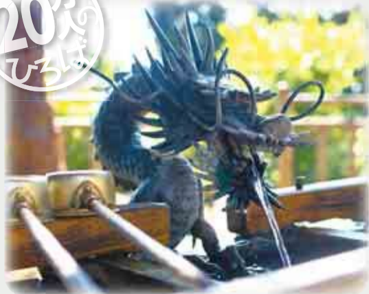
▲飯綱神社の手水舎。龍の口から出る水で、手などを清めます