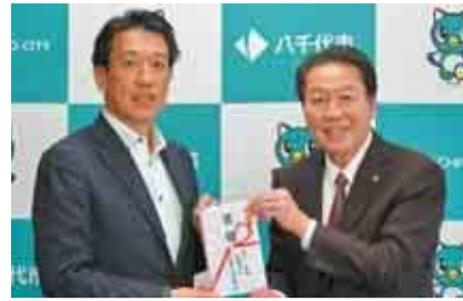
▲服部市長(右)と明治安田生命保険相互会社船橋支社長(左)様