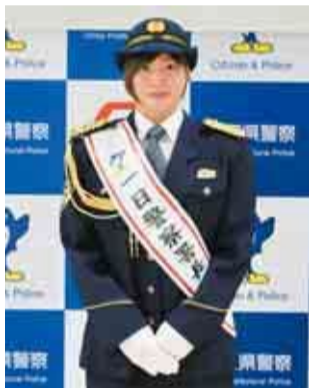
▲一日警察署長を務めた角田夏実選手

八千代警察署は、5年12月14日にイオンモール八千代緑が丘で「年末年始特別警戒及び冬の交通安全運動キャンペーン」を開催しました。当日は、八千代高校吹奏楽部の演奏や防犯・交通安全教室、出動式が行われ、一日警察署長を本市出身でパリ五輪の女子柔道48kg級代表に内定している角田夏実選手（SBC湘南美容クリニック所属）が務めました。角田選手は出動式の指揮の後、駅周辺を巡視。「日常の大切な生活を守るためにも、犯罪や交通事故をなくしましょう」とコメントしました。