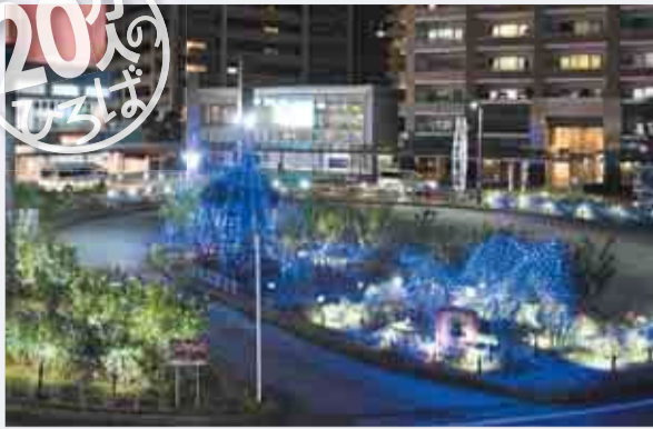
▲八千代緑が丘駅北口バラ園で緑が丘ローズハーツふれあいフェスタ実行委員会により、恒例のイルミネーションが開催されています。期間は2月14日(水)まで。