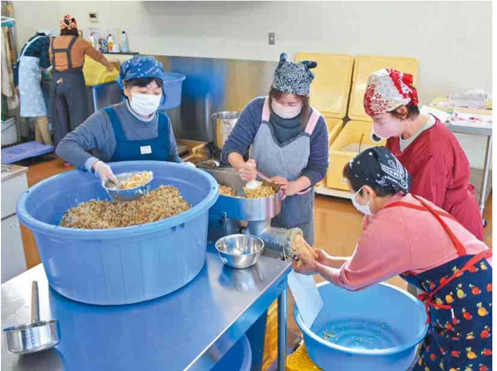
▲味噌の仕込みは雑菌が繁殖しない気温の低い時期が適していると言われています

5年12月、やちよ農業交流センターで、「一日で仕込める味噌作り教室」が開催されました。教室では、蒸し上がった大豆を冷やして、塩こうじと混ぜたものをすりつぶし、味噌玉を作りました。