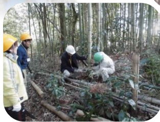
実習 竹柵作り (竹切出し)