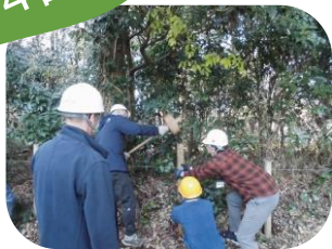
実習 竹柵作り (杭打ち)