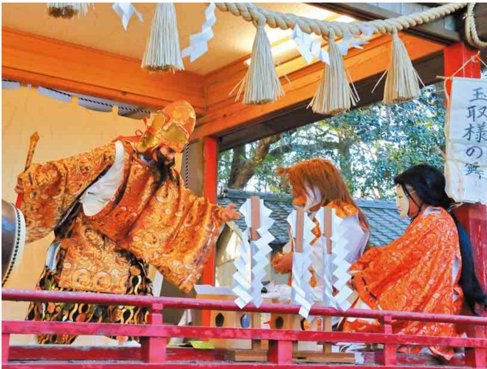
▲村上の神楽は、七百餘所神社で五穀豊穡や平安の祈念と感謝を目的に舞われます

昭和29年に大和田町と睦村が合併し「八千代」の名称が使われ始めて今年で70年。この名称には、千代に八千代に発展し続けるまちななるようにとの願いが込められています。毎年1月と10月に七百餘所神社に奉納される村上の神楽も、江戸時代以前から受け継がれてきたもの。先人たちがこの「八千代」で刻んできた歴史や伝統を受け継ぎながら、未来に向かって飛躍・発展するまちを目指していきます。