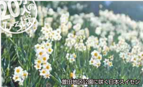
萱田地区公園に咲く日本スイセン