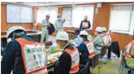
▲被災想定が訓練直前まで明かされない実践的な訓練を行っています

1月17日に災害対応訓練を実施しました。訓練は、千葉県北西部で震度6強の地震が起こった想定で行われ、災害対策本部の設置や運営についての手順を再確認しました。令和6年能登半島地震の被災地に、本市からも職員を派遣し、住家被害認定調査や避難所運営などの業務にあたっています。引き続き、被災地の支援に取り組んでいきます。