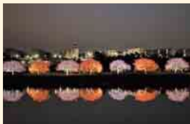
▲約500mの桜並木がライトアップされ、昼間とは違った風情が楽しめます

▼日時 3月2日(土)・3日(日)午前10時～午後8時(小雨決行・荒天中止)。エコライトアップは3月2日(土)から10日(日)までの午後5時～8時(雨天時は点灯なし)。▼場所 道の駅やちよ周辺 ▼問い合わせ 八千代新川千本桜まつり実行委員会(八千代市観光協会内) ☎(407)0192 (観光推進室)