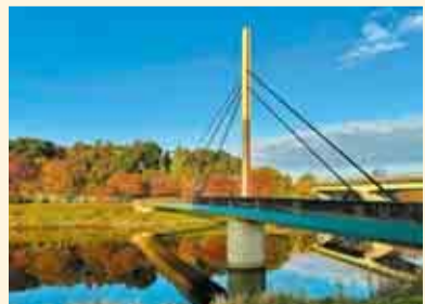
▲秋のフォトコン2023で大賞を受賞した作品「朝のなかよし橋」

▼期間 2月16日(金)から3月15日(金)まで ▼場所 市役所1階総合案内付近 (観光推進室)