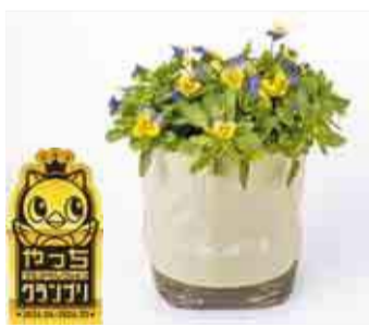
▲エコモットを使った鉢植え

その他に、Metalsmith iiji(メタルスミスイジ)の一輪一輪心を込めて制作した金属製のバラ「メタルローズ」、