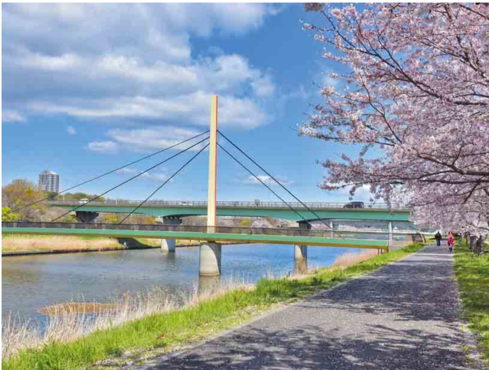
▲なかよし橋(手前)は、子どもたちから募集した絵を元に、楽しい夢・童話的な世界をテーマにデザインされました

新川大橋となかよし橋は昭和59年に同時に開通し、今年で40年を迎えます。これまでたくさんの人びとの笑顔やふれあいをつなぐ架け橋となってきました。