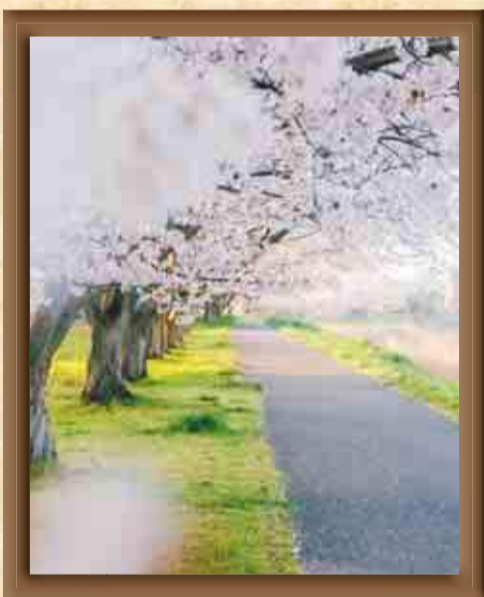
【選考委員コメント】 ▲ hiroaki_inoueさんの作品 桜の満開度も絶妙。地面の緑と桜の淡いピンクがとても綺麗で、前ボケも美しいです。