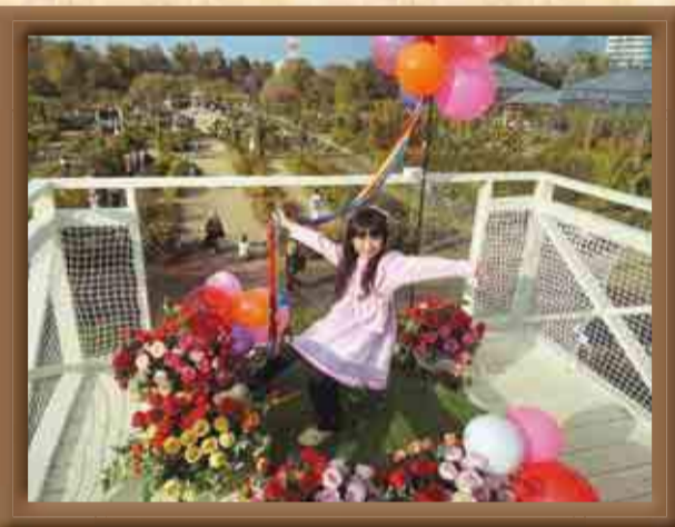
【選考委員コメント】 ▲ flower__orangeさんの作品 楽しそう!女の子が全てを物語っている。バラ園で、楽しいところで、女の子の憧れを叶えられるような場所なんだなというのが良く伝わってくる作品。