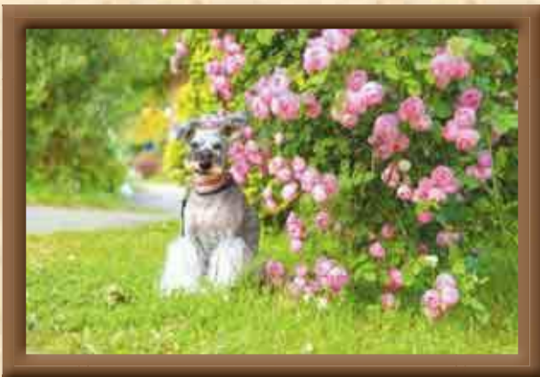
【選考委員コメント】 ▲ mk5512さんの作品 この場所にワンちゃんを連れて行ってみたいと思っただけの作品。バラとワンちゃんのバランス、背景のボケの感じがとても綺麗です。