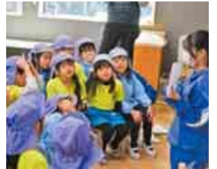
▲手作りの絵本に興味津々な園児たち

この取り組みは、村上東中学校の幼児教育の一環として始まり、読み聞かせに使う絵本は、家庭科の授業で作りました。お兄さんお姉さんが読んでくれる絵本に、目をキラキラさせながら耳を傾ける子どもたち。村上東中学校の生徒は、初めは緊張しつつも、慣れてくるとお互い笑顔が増えていきました。読み聞かせが終わると、校庭で一緒に遊び、楽しく貴重な一日となりました。