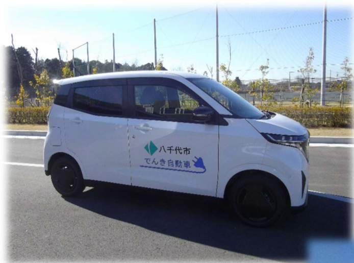
市役所本庁舎に導入した電気自動車