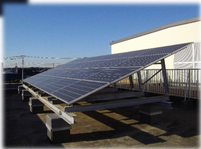
西八千代調理場の太陽光パネル