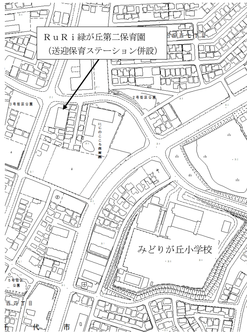
(1) 高津・緑が丘地区 (A)