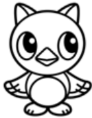
八千代市イメージキャラクター「やっち」