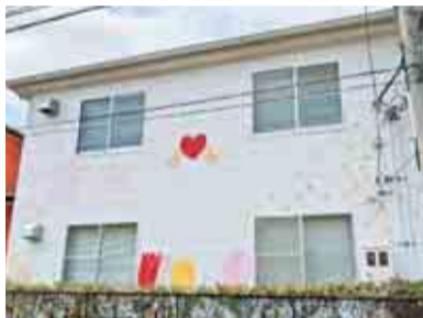
▲「ほっこりゆりのき」は気軽に足を運ぶことができる住民主体の居場所です

旧市民活動サポートセンターが社会福祉協議会に無償譲渡され、「ほっこりゆりのき」として開所します。壁面2面には、萱田中学校美術部がイラストを塗装しました。普段は使わないペンキに苦労する場面もありましたが、同中学校OBに教えてもらいながら完成することができました。生徒は、「多くの人から褒めてもらった。貴重な経験ができ、感謝しています。」と話しました。