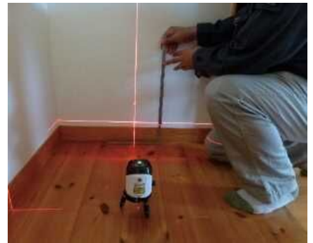
「床の傾きを計測する」調査機器