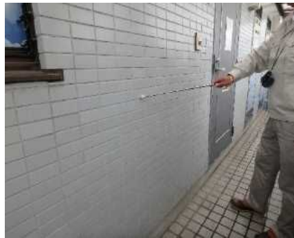
「外部（外壁）」調査の様子