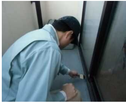
「外部（バルコニー）」調査の様子