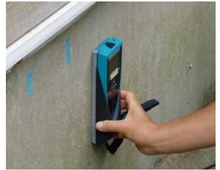
「基礎配筋」の調査機器