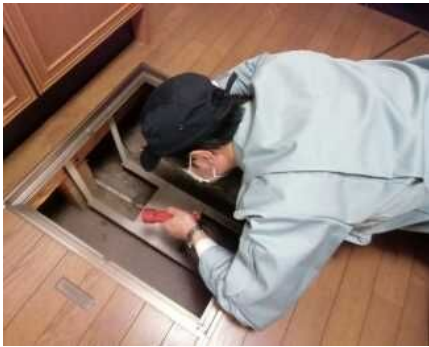
「土台・床組、基礎」調査の様子