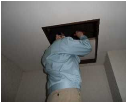
「小屋組・梁」調査の様子