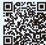
▲Web口座振替受付サービス

市Web口座振替申請サービスから申請をしてください。金融機関によって、入力に必要な情報が異なりますのでご確認ください。