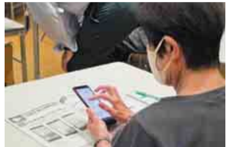
▲災害用伝言板を使って伝言の登録や確認を行いました

受講した72歳の女性は「今までスマホの使い方がわからなかったがよく理解できた。家でも防災アプリを使ってみようと思う」と話し、82歳の女性は「災害対策アプリは初めて使った。家が川の近くで氾濫などの不安もあるので、参加してよかった」と話しました。