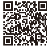
▲地方税お支払サイト

読み取ることで納付できます。アプリによっては納付できる金額に上限があり、手数料がかかることもあります。通信料金（パッケージ代など）は自己負担です。