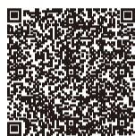
▲ちば電子申請サービス

地方税お支払サイトからの納付書申請は受け付けていません。ちば電子申請サービスを利用してください。