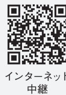
インターネット中継