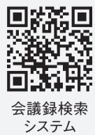
会議録検索システム