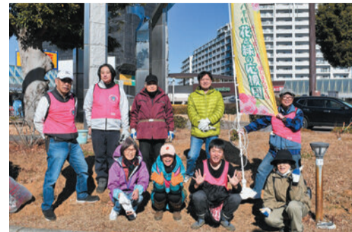
▲八千代花と緑の応援団八千代中央支部の皆さん

ベントで「八千代花と緑の応援団」に声をかけてもらい参加したとのこと。「駅前を明るくして、利用者がバラを見て笑顔になってもらえたら嬉しい。一緒にやってみたいなと思われたら、気軽に声をかけてほしい。」と話してくれました。