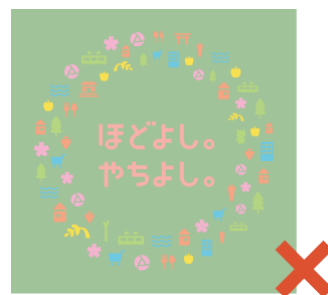
不明瞭な表示 (P.07を参照)