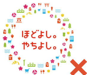
基本色以外の表記