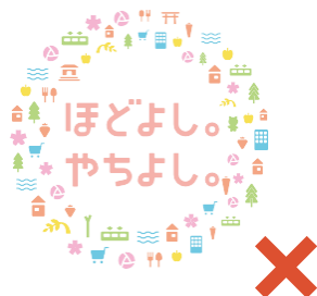
ロゴタイプとアイコンの比率の変更