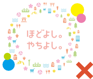
スペーシング範囲内に オブジェクトを配置