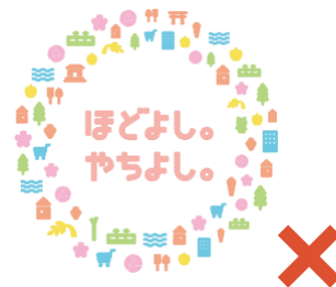
アウトラインの追加