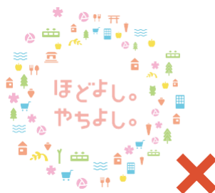
ロゴタイプやアイコンの 位置の変更