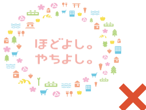
基本形以外への変形