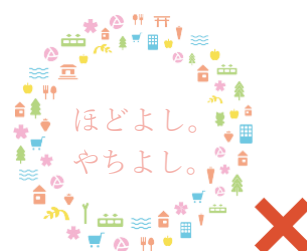
ロゴタイプ以外のフォントでの表記