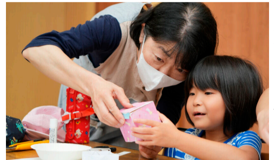
◀工作教室なども開催

中央図書館では、学校・保育園や地域で読み聞かせを行う団体へ貸出をしています。団体貸出は市内でおはなし会などの活動をする人も利用できます。絵本や紙芝居、物語などの本が200冊まで、2か月借りられます。大型の絵本や紙芝居もあります。