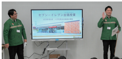
▲講師のセブン-イレブン本部のお二人

9月4日、セブン-イレブンが大和田小学校を訪問し、小学3年生77人に同社が行う廃プラスチックや食品ロス削減の取り組みを紹介しました。また、10月4日(土)～19日(日)の期間、児童が作成した食品ロス削減を促すポップがセブン-イレブン3店舗(八千代中央駅南店・八千代大和田店・八千代大和田北店)に掲示されます。