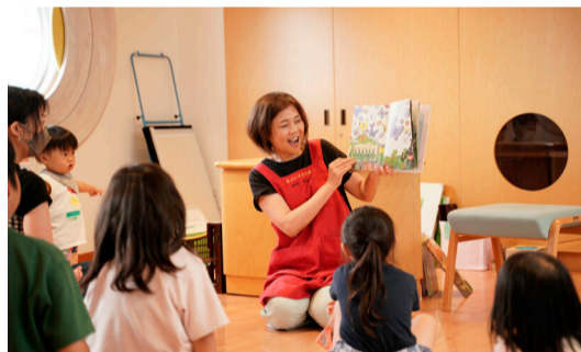
大人気のおはなし会

おはなし会では、絵本の読み聞かせや紙芝居などをしています。赤ちゃんと楽しむ絵本の会、英語のおはなし会、手話のおはなし会、中学生のボランティアによるおはなし会などもあります。