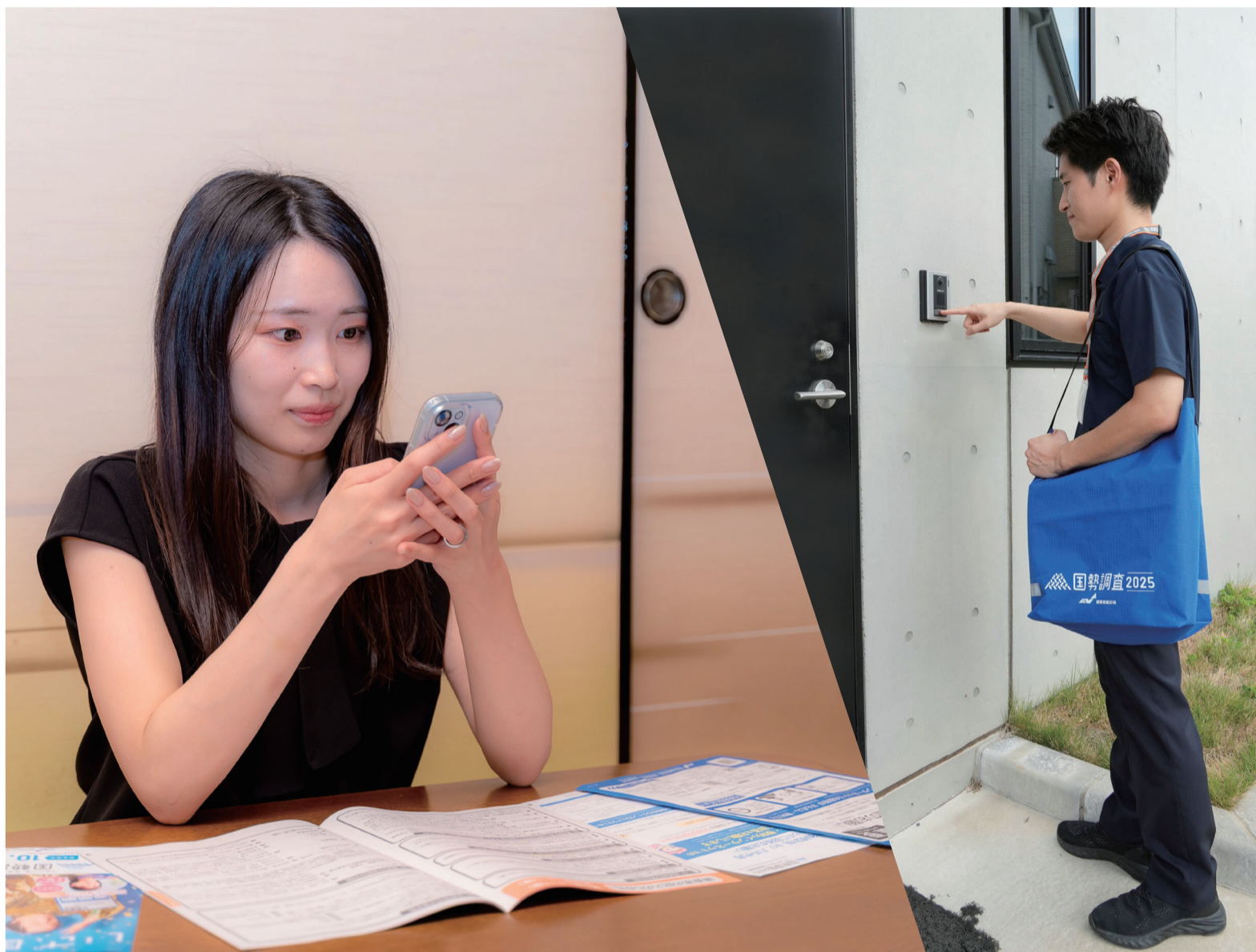
▲24時間回答できるインターネット回答が便利です。国勢調査員は、必ず顔写真付きの「調査員証」を携帯して訪問しています。

国勢調査は5年ごとに実施される国の最も重要な調査で、日本に住む全ての人が対象です。調査結果から人口や社会の実態を把握し、社会福祉や災害対策など、幅広く活用されます。調査員が9月下旬から自宅を訪問し、調査票やインターネット回答のためのIDなどの書類を配布しています。回答期限は10月8日(水)までです。私たちの未来をつくる大切な調査に、ご協力をお願いします。