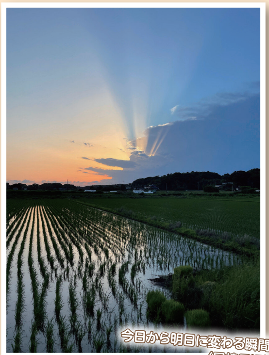
今日から明日に変わる瞬間 (尾崎周辺)