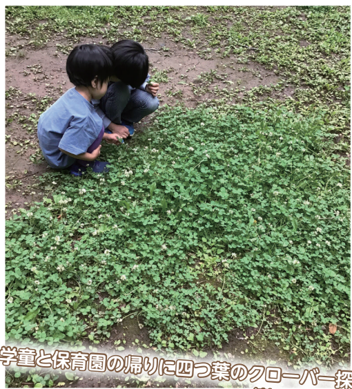
学童と保育園の帰りに四つ葉のクローバー探し (萱田第1緑地)