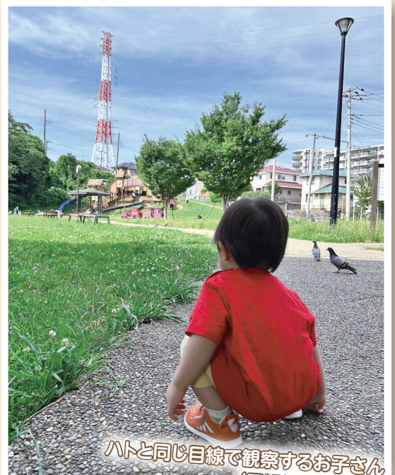
ハトと同じ目線で観察するお子さん (黒沢池近隣公園)