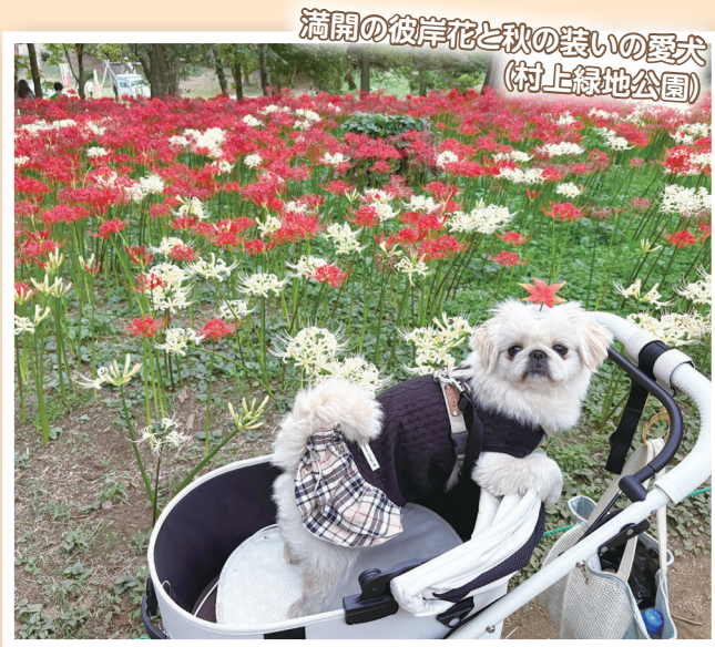
満開の彼岸花と秋の装いの愛犬 (村上緑地公園)