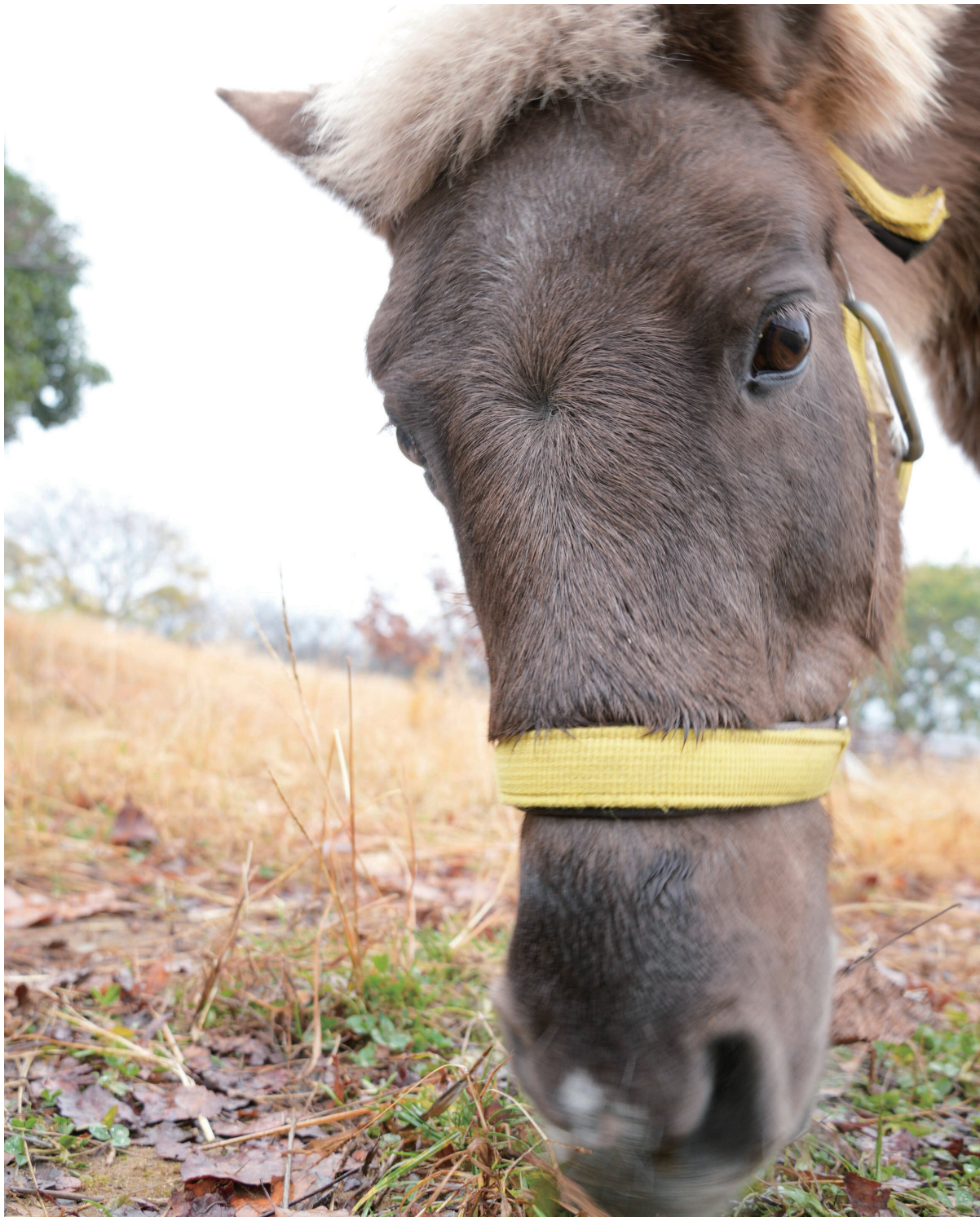
▲子どもたちの成長を見守るブライト、萱田小やボランティア「萱小F.C」の皆さんに大切にされています

●八千代の人口 20万8,232人(-2人) 男 10万2,624人(+10人) 女 10万5,608人(-12人) ●八千代の世帯 10万580世帯(+44世帯) 7年11月末現在。( )内は前月比