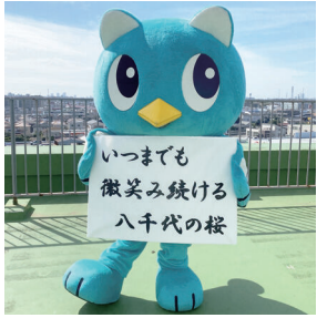
▲大会テーマとやっち

7年7月15日から9月8日の期間に大会テーマの募集を行いました。ご応募いただいた中から、実行委員会においてこの大会テーマに決定しました。沢山のご応募をいただきありがとうございました。