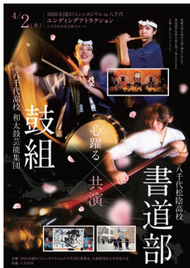
▲県立八千代高校「鼓組」・八千代松陰高校「書道部」