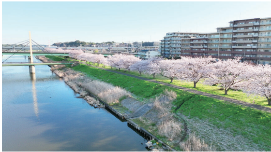
▲新川千本桜（染井吉野）