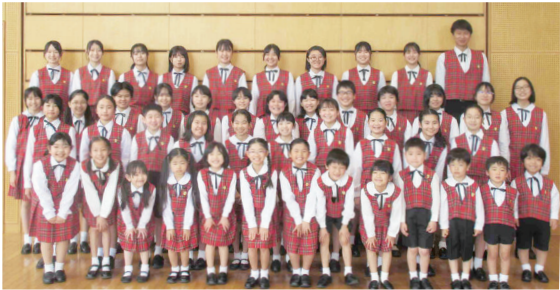
▲八千代少年少女合唱団