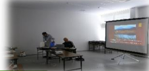
里山活動団体による発表