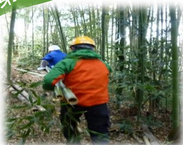
実習 竹柵作り (竹切出し)