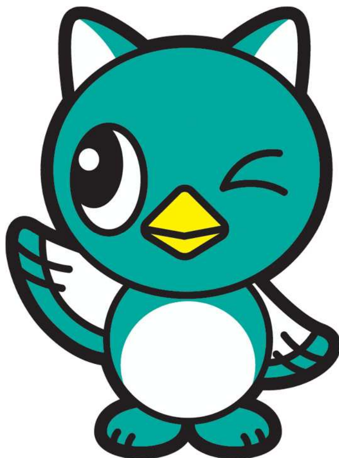
八千代市イメージキャラクター「やっち」