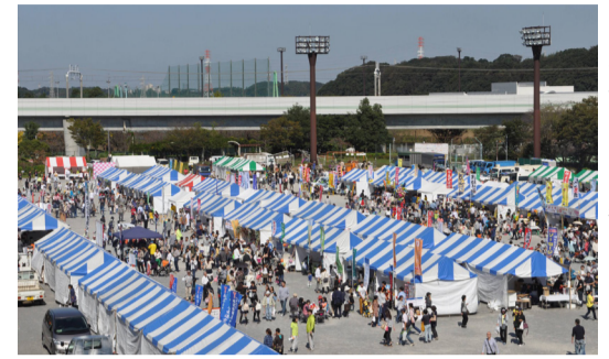
八千代どーんと祭