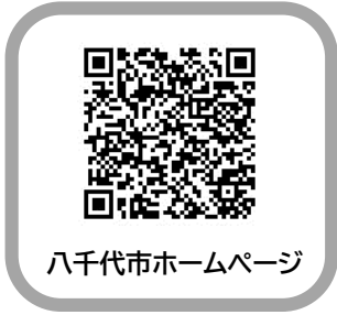
八千代市ホームページ