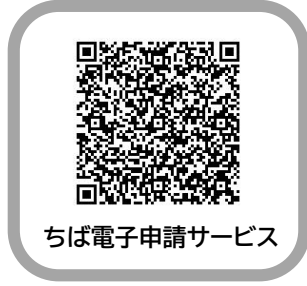
ちば電子申請サービス

市内へ転入された方、 受診券を紛失された方は、 こちらから受診券の 発行申請ができます。