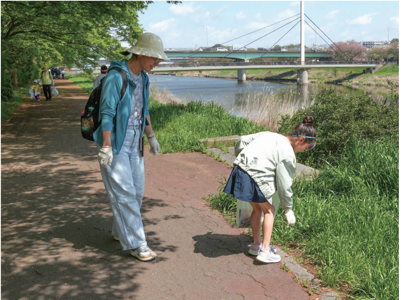
▲子ども連れの家族も参加し、大和田機場と宮内橋間の新川遊歩道を歩きながらごみを拾っていきました

新川と印旛沼の美しい環境を守るため、4月11日、新川兩岸の遊歩道を清掃する新川一斉清掃が行われました。これは、印旛沼へのごみなどの汚染源の流入を防ぐと共に、新川や印旛沼の水質保全に対する意識を高めるための印旛沼浄化推進運動です。当日は、市内事業所、市民団体や市民など252人が参加し、空き缶やビン、ペットボトルなど計130キログラムのごみを回収しました。