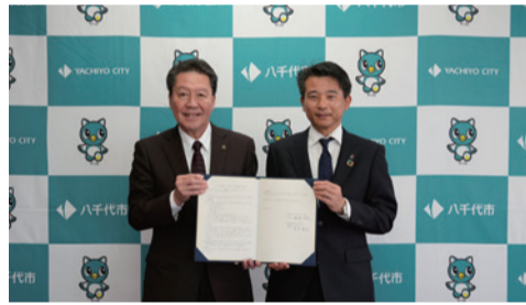
▲服部市長(左)と損害保険ジャパン(株)米本千葉西支店長(右)

総合防災訓練における訓練内容の充実や健康アプリを活用した取組など幅広い分野で連携を図ります。