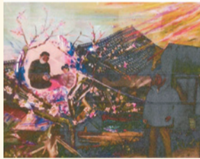
「復活への誓い」 作 石井 千枝子