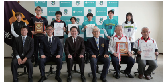
▲市役所での優勝報告

7年度に行われた千葉県民スポーツ大会で、サッカー男子・女子、バレーボール男子、アーチェリーが優勝を果たし、3月30日、服部市長と嶺岸教育長へ優勝報告がありました。サッカー男子・女子は初優勝、バレーボール男子は39年ぶり2回目の優勝、アーチェリーは3年連続4回目の優勝となります。