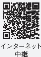
インターネット中継

募集 ファミリー・サポート・センターの協力会員 お子さんの預かりや保育施設への送迎など、一時的・補助的な支援を行う有償ボランティアの協力会員を募集しています。資格は不問ですが、基礎研修会の受講が必要です。 ▼基礎研修会の日時/場所 6月4日(木)午前9時30分～午後3時10分/市民会館第4会議室 ▼申し込み 6月1日(月)までに下のコードから電子申請か電話で同センター画(411)6748(平日の午前9時～午後4時)へ (子ども保育課)