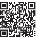
▲塀チェックポイント

自宅にブロック塀のない人も、普段から通行する道や通学路の安全点検をして、道沿いに高いブロック塀がある場合は、なるべくブロック塀から離れる、ほかの道を通行するなどの対策を日頃から心掛けましょう。