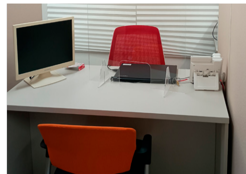
▲「しえん」相談ブース。五つのブースがあります

仕事が続かない…、家賃が払えなくなった…、家計のやりくりが大変…、借金の支払いが大変…、引きこもりで悩んでいる…などお困りのことはありませんか？市には、このような困り事を抱える人に相談員が一人ひとりに寄り添い、解決に向けて支援する相談窓口「生活・仕事・自立相談窓口しえん」があります。この特集のお問い合わせは、福祉総合相談課☎483-1151へ。