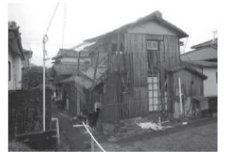
▶防災性の低下に伴い建物の外壁が朽ちて倒壊の恐れがあります