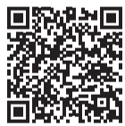
▲住宅耐震診断相談会

開催日程は右の表のとおりです。耐震・建築相談会は予約が必要です。予約の申込書は、