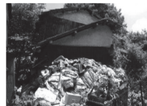
◀ごみの不法投棄による衛生の悪化や火災などの恐れがあります