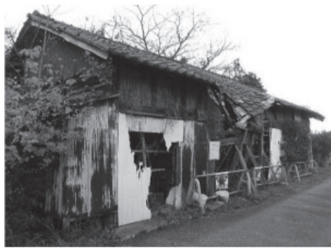
▲防犯性の低下に伴い不審者の侵入などの恐れがあります