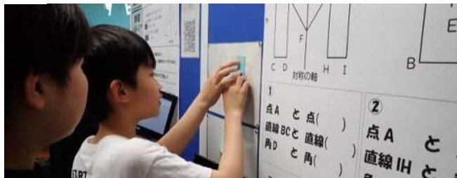
▲先生が用意した教材に夢中に取り組む姿

デジタルという基盤を活かし、先生方の誰一人取り残さない授業づくりを楽しみにしています。