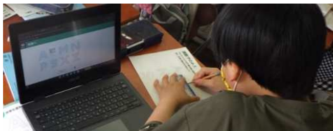
▲端末内の教材を参考に学びを進める姿▼