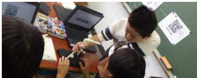
▲協働しながら学びを深める姿

“本時の子どもの姿がどうだったか”ではなく、 子どもの学びがどのように変わったか を見取ることが大切なのではないだろうか