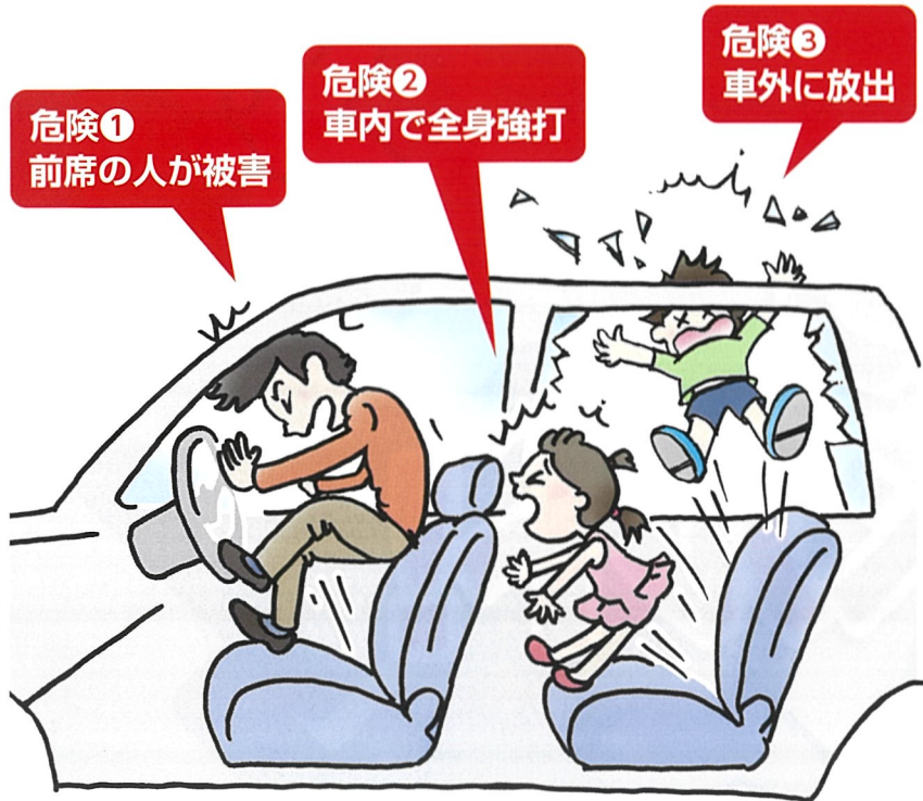
自動車後部座席同乗中死傷者のシートベルト着用・非着用別致死率【令和3年～令和7年】合計