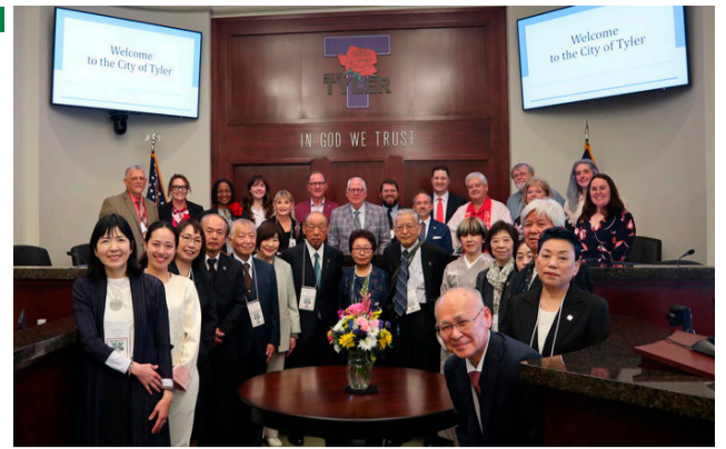
▲市長表敬訪問ではタイラー市の皆さんと記念撮影も

本市とアメリカ合衆国タイラー市は、平成4年に姉妹都市提携を結び、親善訪問団による交流を続けています。3月25日から31日まで本市の親善訪問団がタイラー市を訪問しました。これまでの歩み、今回の訪問の報告や感想などを紹介します。お問い合わせは、シティプロモーション課☎421-6703へ。