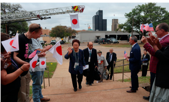
▲タイラー市役所への表敬訪問では、日本とアメリカの国旗を振って温かく出迎えてくれました

現地では、市長表敬訪問を始め、公共施設の見学や文化体験を行いました。公共施設見学では、高齢者が集まって交流できる「シニアセンター」を訪問し、高齢者向けの運動プログラムや料理プログラムの説明を受けました。アメリカには公的な保険制度がないため、高齢者が交流できる場所が非常に重要であると分かりました。テキサス大学タイラー校を