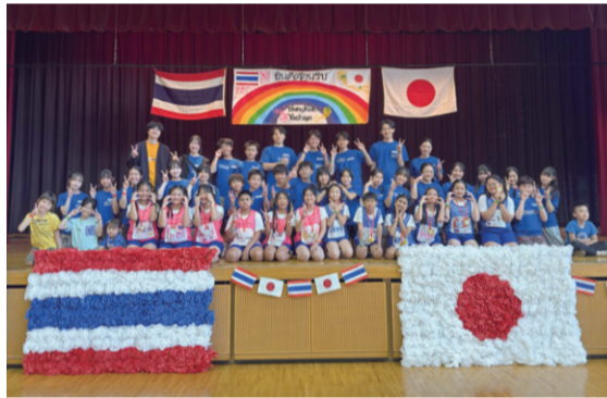
▲会場となった総合生涯学習プラザ。「ダイラックアン」は紙で両国の国旗を作り親善大使たちを迎えました

帰国してからもその気持ちが変わることはなく、平成16年4月に「バンコクの人たちに恩返しをしたい」「いつまでも交流を続けたい」という想いを持った有志が、OGOB会「ダイラックアン」を立ち上げました。