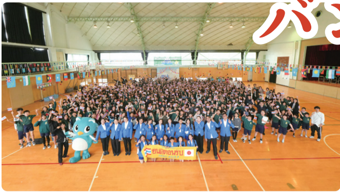
▲勝田台小学校体育館で記念撮影。学校交流会を通じて、勝田台小学校の子どもたちも世界に目を向ける一日となりました