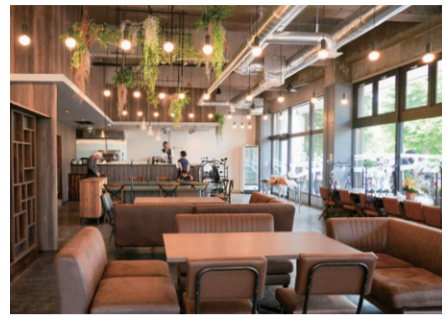
▲5月25日プレオープン直前の店内。40人以上の地域住民の皆さんが正午の開店を待ちわびていました

米本団地の旧銀行跡地に、UR都市機構と株式会社天神による地域の拠点が新たにオープンしました。団地カフェの新モデルとして、低価格帯での飲食提供、子育て世帯や高齢者など多世代コミュニティの形成、花見川・新川流域一帯の魅力を発信するうみさとプロジェクトのイベントの開催に加え、団地の住民を積極的に雇用するなど、地域の活性化が期待されます。