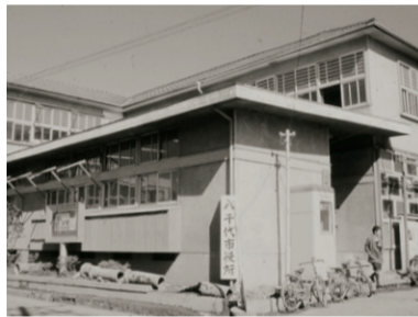
▲旧市役所庁舎(昭和43年撮影)

思い出の1枚が、市の歩みを取めた貴重な資料となりますので、この機会にぜひご応募ください。