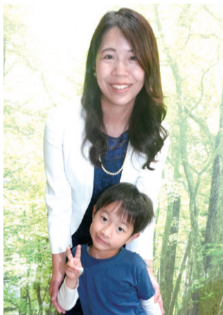
▲受賞歌のモデルとなったお子さんと一緒に記念撮影

日記や心に残ったことを書き留めることが趣味で、目にした公募雑誌から、気軽な気持ちで短歌を投稿したことがきっかけで楽しみながら15年。短歌は、健康な人だけでなく、ご高齢の人や病床に伏されている人も、日々の小さな発見や自分の人生を通じて紡ぎ出すことで、心を外の世界へ広げ、生きた証や感情を美しい文学として残すことができるもの。市民の皆さんにも触れてもらいたいと話していました。