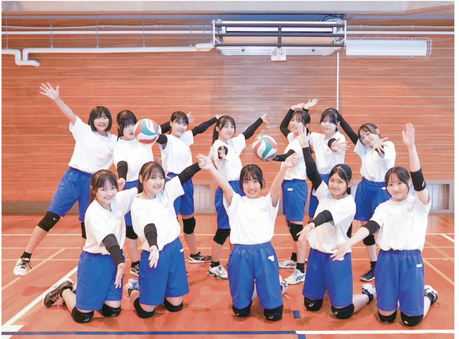
▲冷房の効いた体育館での第一声は「涼しいー!」。エアコンの設置により危険な暑さから解放され、快適に過ごすことができる環境となりました

市では、近年の夏の酷暑に対する教育環境の改善などを目的に、市立中学校および義務教育学校の体育館にエアコンの設置を進め、7月1日から運用を開始します。体育館は児童・生徒の学校生活の場所であるとともに、災害時には住民の避難所になるなど、地域の拠点としての役割も果たします。市立小学校のエアコンも9年7月の運用を目指して準備を進めています。インタビューは8面で。