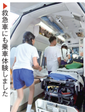
▲救急車にも乗車体験しました

世界一渋滞する都市と言われるバンコクでは、小型の消防車が多く、大型の消防車を見る機会が少ないと言われています。これを受け、中央消防署を訪問し、日頃から行われているレスキュー訓練の見学や大型消防車の乗車体験などを行いました。