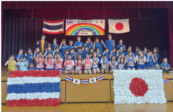
▲会場となった総合生涯学習プラザ。「ダイラックアン」は紙で両国の国旗を作り親善大使たちを迎えました

帰国してからもその気持ちが変わることはなく、平成16年4月に「バンコクの人たちに恩返しをしたい」「いつまでも交流を続けたい」という想いを持った有志が、OGOB会「ダイラックアン」を立ち上げました。