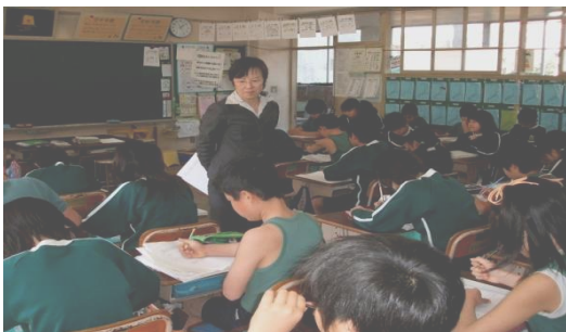
子どもたちも新しい発見があったかな？

小さなころから等しく認めあうことを学んで、その中から自分を知りみんなを理解することを学びました。