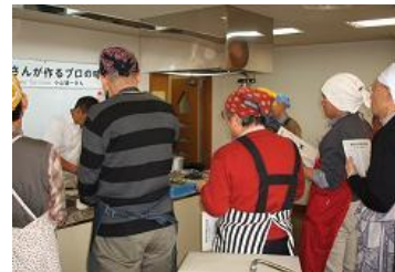
先生の「アッ」と驚く技に皆さんの驚きの声・・・

お父さん達も「仕事」「家庭」「地域」「趣味」のいずれにも根をはり、回りの人たちとのよい関係を築いていく事が大切です。プロの味を学ぶことを通じてよりよい地域・家庭参画を目指しました。