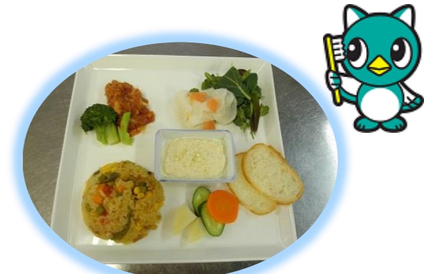
▲見た目にも楽しい「ランチプレート！」