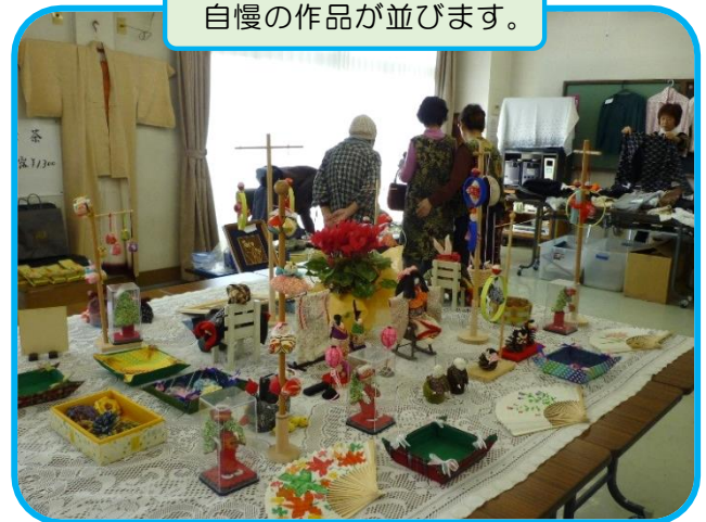
自慢の作品が並びます。

午後からは2階和室で、やちよ元気体操・練功十八法の健康体操をし、お隣の名木児童公園では、グラウンドゴルフ発ゲームで大いに盛り上がりました。