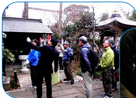
簡易担架を実際に作って…