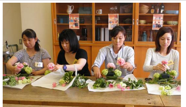
真剣なまなざしのママたち(・_・)

5月18日(1回目)には、パパが赤ちゃんと一緒にベビースインを学習しました。ママは別室でフラワーアレンジメントに挑戦！「はじめての体験！」というママが多く、みんな真剣そのものでした。