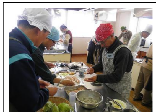
「えびの背ワタって、こうやって取るんだ！」