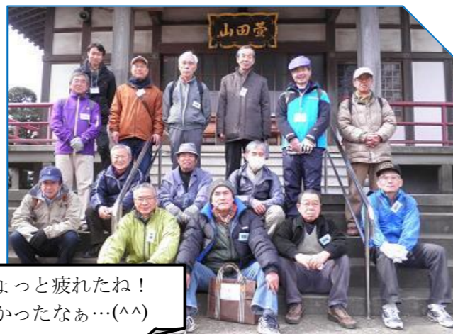
いやあ、ちょっと疲れたね！でも、楽しかったなあ…(^^)