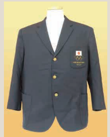
1964年オリンピック東京大会の役員用ブレザー