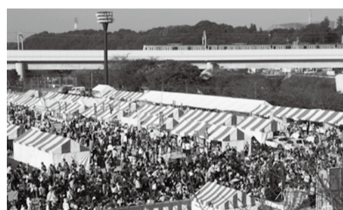
▲八千代どーんと祭には11万2,000人が参加