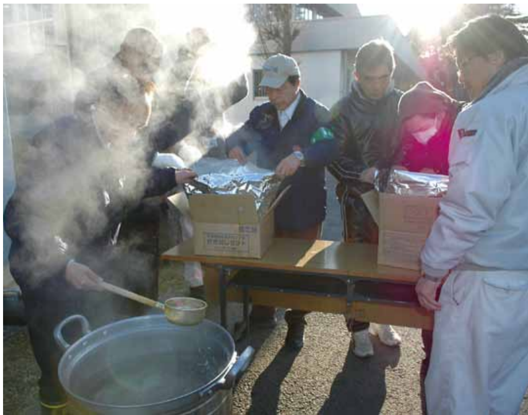
▲避難所になった米本小学校では、12日朝に炊き出しが行われました

3月11日に発生した東北地方太平洋沖地震は、市内でも震度5強の揺れを観測。東北地方では、多くの尊い命が失われ約39万人が避難生活を送っています。