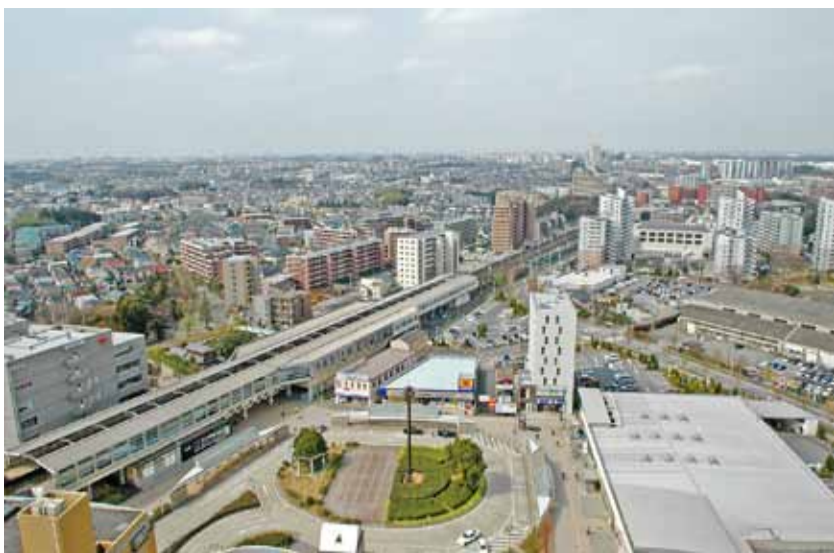
▲八千代中央駅周辺