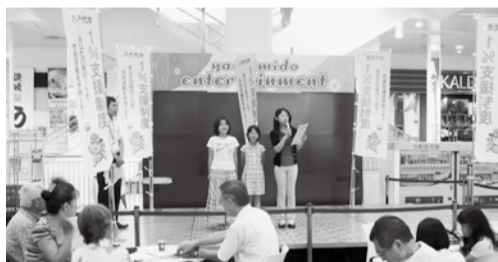
▲1%支援制度の支援を希望する団体のPR活動

り災証明書の交付は総務課で り災証明とは、地震などの自然災害により住家などが破損した場合、その被害の状況を判定し証明するものです。この証明は、保険金の請求や税の申告などの手続きに必要とされます。 ■り災証明書発行までの流れ ①り災証明書交付申請書に被害状況の写真を添付し、総務課へ提出(郵送可) ②職員が現場を確認 ③状況の確認ができ次第、り災証明書を郵送 ※早急に修繕、工事などが必要な場合は、事前に被害状況の写真を撮ってから施工してください。り災証明書交付申請書は市役所3階総務課窓口で配布。市ホームページからもダウンロードできます (総務課)