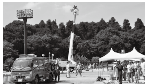
▲22年9月実施の防災訓練