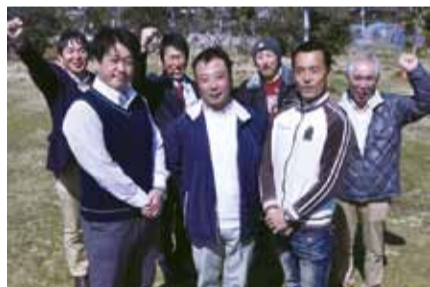
▲若手農家を応援する実行委員会(後列)

農業に関心のある独身女性の皆さん、市内の農家の青年と農業体験をしてみませんか。農業者婚活事業実行委員会では「楽しく、おいしく」をキャッチフレーズに、5月8日(日)に農業体験交流会を開催します。この交流会は、女性に市内の農業に興味を持ってもらうことや、若手農家の婚活の機会をつくることを目的に、有志が実行委員会を立ち上げて企画。今回が初めての試みです。田植え、イチゴや野菜などの収穫、地元の野菜を使った料理交流会などを行う予定です。20歳以上の独身女性なら、どなたでも参加できます。参加費は、一人2,000円。先着20人までです。