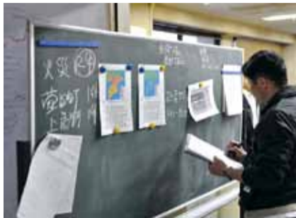
◀ 関係機関への対応に追われる総合防災課