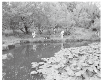
▲ほたるの里の整備