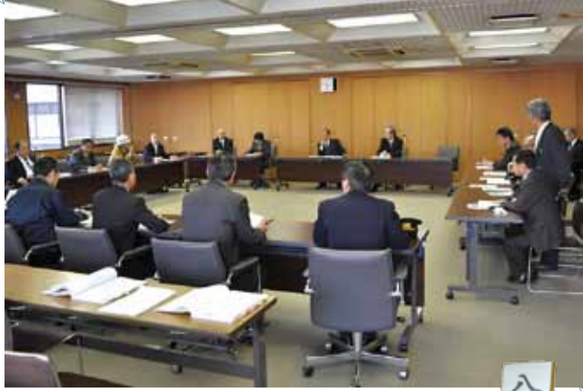
▲被害状況を確認する、八千代市災害対策本部