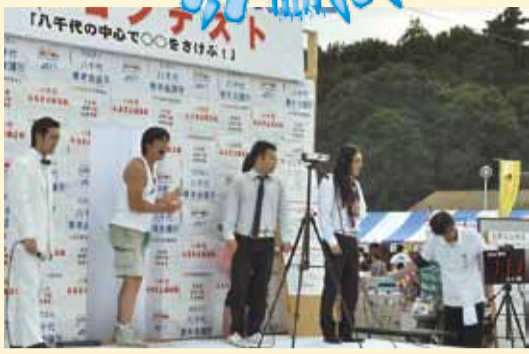
▲「カメハメハー」と叫んで優勝しました