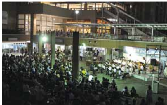
▲八千代東高校吹奏楽部の演奏

今年は、東日本大震災の復興を願い、「希望の想いこの音楽にのせて」をテーマに開催。八千代緑が丘駅南側駅前広場では、たくさんの方が足を止め、心のこもった演奏に耳を傾けていました。8月25日と26日の2日間行う予定でしたが、雨のため、残念ながら26日は中止になってしまいました。