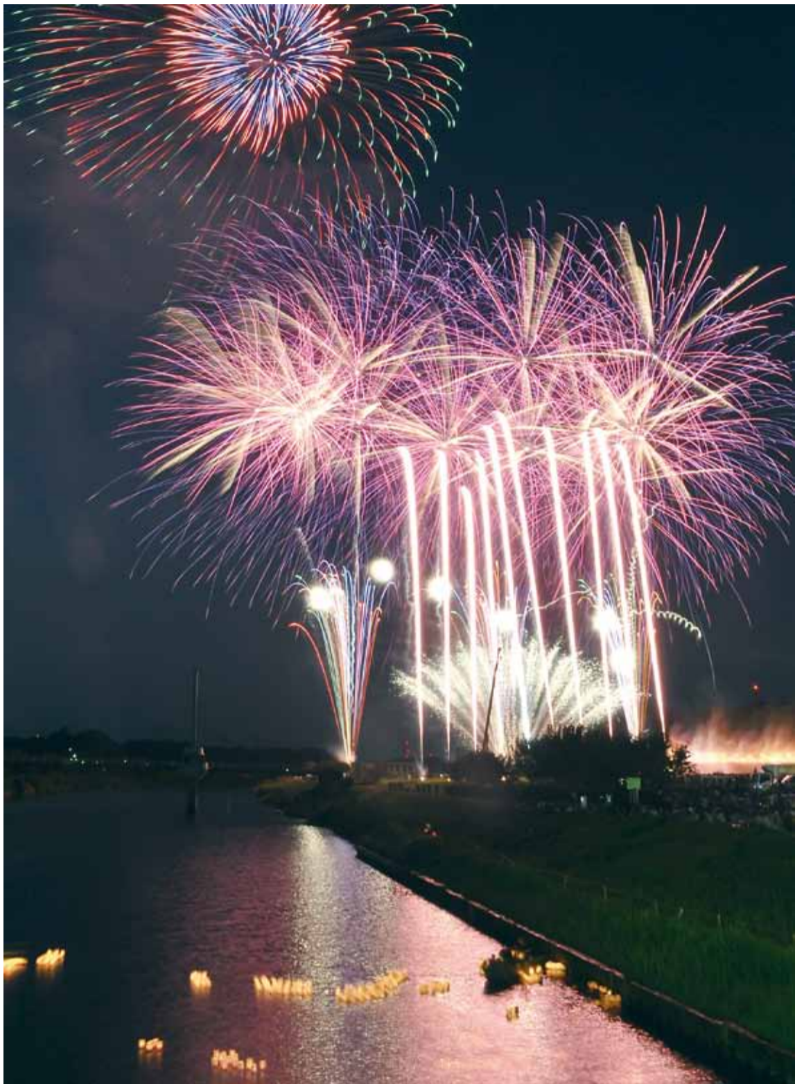
▲打ち上げ花火で彩られた新川。橙色に輝く灯ろうが、船の上から次つぎに流されていきます