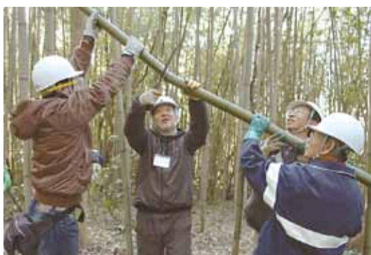
▲竹を切って里山を整備します

花見川上流の弁天橋周辺の自然を観察します。自然に関する興味や関心のある人、里山の成り立ちや植生の特徴を学びませんか。先着30人。動きやすい服装、履物で。 ▼日時 10月2日(日)午前9時～正午 ▼集合場所 京成バス「弁天入口」停留所(勝田台駅からバスで約7分) ▼費用 50円(傷害保険代) ▼申し込み・問い合わせ 電話か直接郷土博物館☎(484)9011へ ※小雨決行