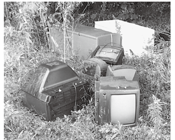
▲勝手にごみを捨てるのは犯罪です

一人一人が監視役になれば、さらに不法投棄を防ぐことができます。廃棄物を積んだ不審なトラックなどを見かけたときには、上記の「不法投棄通報受付専用電話」まで連絡してください。