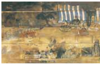
▲雨乞い祈禱の絵馬

古来は生きた馬を神馬として神社に献上し祈願していましたが、次第に馬の絵を板に描きそれを奉納