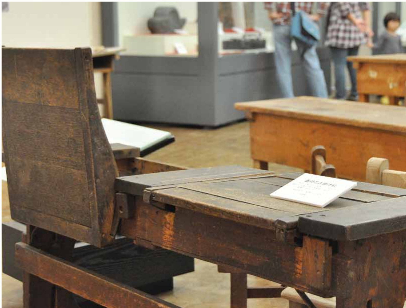
▲収蔵品が並ぶ企画展示室。12月には企画展「八千代の遺跡～萱田地区～」を実施します。詳細は同館☎484-9011へ

10月8日～11月13日、郷土博物館で企画展「くらしのうつりかわり展～学校のいま・むかし～」が行われました。昔の机や教科書、給食のサンプルなどおよそ70点を展示し、時代とともに変化してきた学校の様子を紹介。ずらりと並ぶ机の前に「懐かしい」と当時の学校生活を子どもに話すお父さんの姿も見られました。同館の敷地は旧村上小学校の木造校舎が建てられていた場所。小学校が現在の村上団地内へと移転した後、昭和52年から郷土資料室として利用されてきました。平成5年に現在の建物となりましたが、校庭にあったクスノキとイチヨウの大木は、歴史を受け継ぎそのまま保存。この地域の移り変わりを見守り続けています。