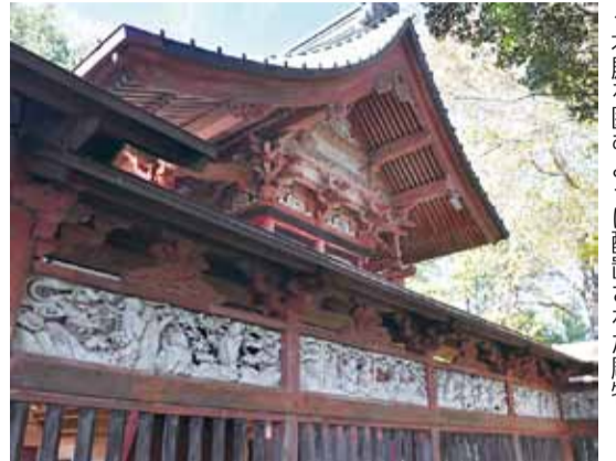
▲本殿を囲むように配置された彫物

して祈願するようになりました。この絵馬には銀面をつけて背に雲珠を乗せた唐鞍馬具の神馬が、二人の狩衣姿の馭者に神前へ引かれていく様子が描かれています。大きさは縦110センチ、横166センチで、天保6年(1835)の銘もみられます。江戸時代後期に描かれたものです。