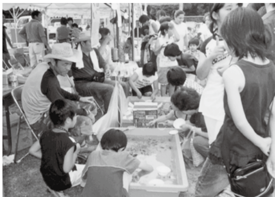
▲地域で開催されるお祭りにも、民生委員は協力しています(社会福祉協議会睦支会のふくし祭りむつみにて)

民生委員・児童委員は、私たちの最も身近なところで、さまざまな相談に乗ってくれる、信頼できるサポーターです。守秘義務があるので、個人の秘密は堅く守られます。困ったときは一人で悩まずに、ぜひ気軽にご相談ください。