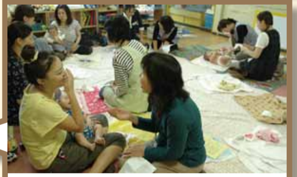
赤ちゃん広場は、地域子育て支援センターなどで開催。計測、育児相談、離乳食や発達の目安、子育てのワンポイントなどのお話や、遊び場・手遊びの紹介をしています。お母さん同士の情報交換の場にもご活用ください。