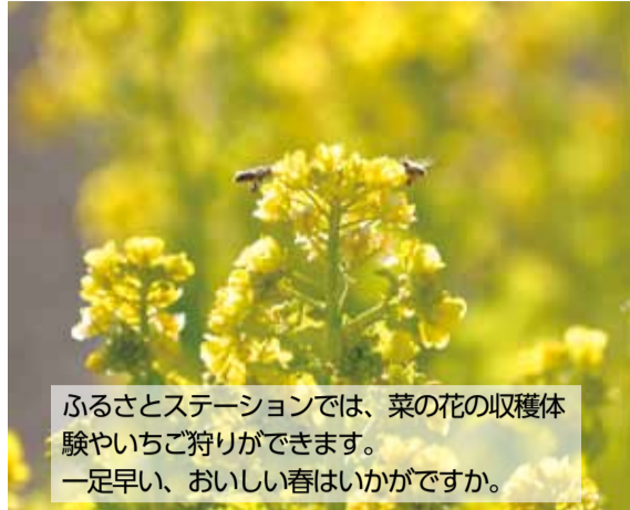
ふるさとステーションでは、菜の花の収穫体験やいちご狩りができます。一足早い、おいしい春はいかがですか。