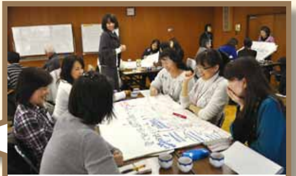
プランの策定にむけて、母子保健推進員、商工会議所や農協の青年部、長寿会連合会などから参加した市民と職員が「市民の健康な暮らしの姿」について自由に意見を出し合っています。23年度はプラン策定委員の市民公募も予定しています。