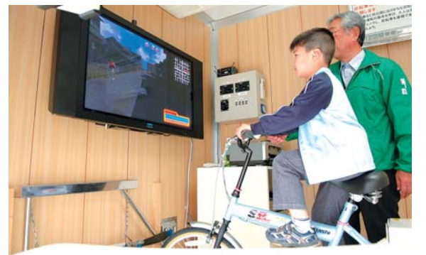
▲自転車シミュレータは安全な運転をしているかどうかを診断することができます

た。会場には白バイやパトカーも展示され、訪れた人は体験乗車や写真撮影を楽しみました。