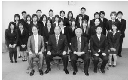
▲4月7日、今年度の学生相談員の委嘱式が行われました。

月曜日~金曜日の午後3時30分~5時 ☎487-5539 (子ども相談センター)