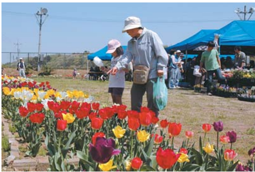
▼「きれいだね」と花を眺める家族

4月11日、ふれあいプラザでふれあいチューリップまつりを開催。ボランティアの皆さんによって植えられた約5,000本のチューリップが並びました。同プラザの利用者や市内の福祉施設による花苗や手作り製品の販売会もあり、会場にはお土産を片手に色とりどりの花を眺める家族の姿も見られました。