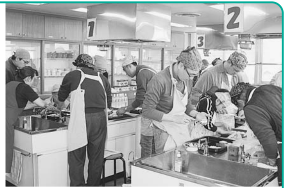
20年度の主催講座。お父さんが作るプロの味「ほっ”と”コーヒーの入れ方とお菓子(ラスク)作り」

子育て中の人も安心して講座に参加できるよう、保育室を完備。センター主催講座では、希望に応じ2歳～6歳のお子さんをお預かりしています。保育者がいれば自主活動でセンターを使うときも保育室を利用できます(要予約)。