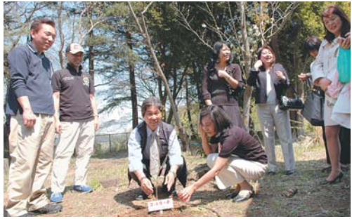
▼植えられた苗木の前には「コッチャカの木」のプレートが埋められました