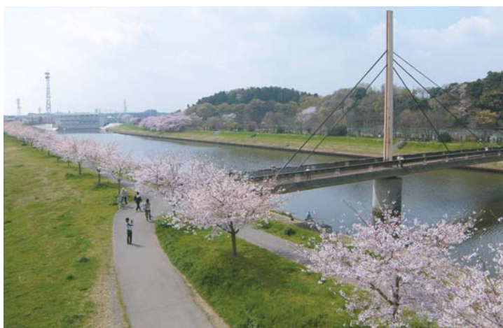
▲新川の遊歩道には今年もみごとな桜が咲きました(4月6日撮影)

「新川千本桜の会」は新川の堤を桜の花でいっぱいしようと、2003年4月に発足した市内のボランティア団体です。大和田排水機場から阿宗橋までの新川両岸に植えられた1,230本の桜を育成、維持、管理しています。