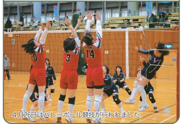
4月26日はバレーボール競技が行われました