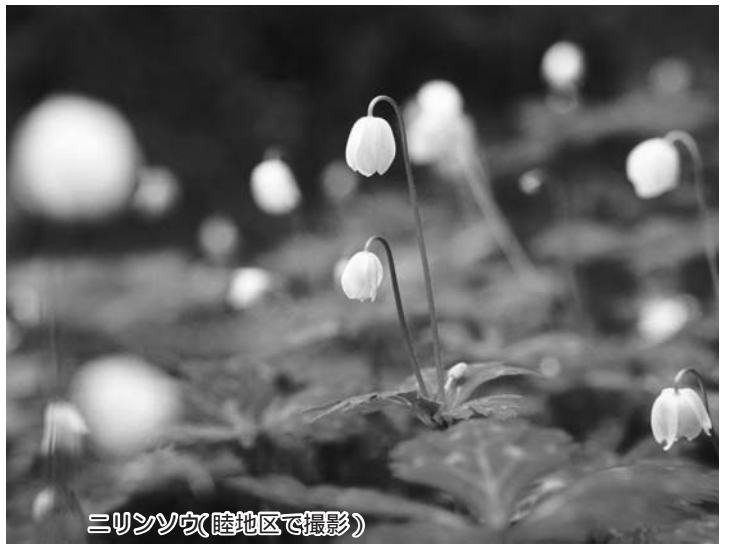
三リンソウ(睦地区で撮影)

適切な焼却炉以外で物を燃やす行為は「野焼き」と呼ばれ、一部例外を除き法律で禁止されています。煙やにおいで周辺の人に迷惑を及ぼすだけでなく、ダイオキシン類を発生させる原因となってしまうので、事業所では産業廃棄物として適切な処理を、家庭ではごみとして出しましょう。