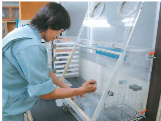
水道水に含まれる細菌の検査

皆さんに安心して飲んでいただける水道水を供給するため、毎年水質検査計画を策定しています。この計画に基づき、水道法で義務付けら