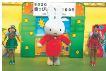
ステージイベント「ミッフィーとうたおう」

今年も、8020歯つっぴいやちよを開催します。フッ化物洗口体験やお口の相談歯ブラシ・石こう人形のプレゼントなどがあります。当日はミッフィーちゃんも来ます。 日時 6月14日(日)午前10時～午後3時 場所 フルルガーデン八千代 内容【ステージイベント】ミッフィーとうたおう(2回開催) 図画ポスター入賞者表彰式 【コーナーイベント】お口の相談、歯みがき相談、フッ化物洗口体験、石こう人形プレゼント、お薬相談など 【展示】小・中学生の描いた図画ポスター優秀作品展示 問い合わせ 市歯科医師会 ☎485)7535