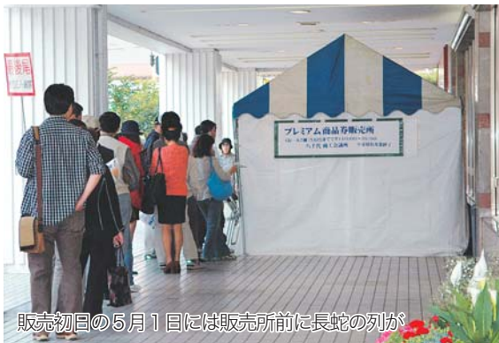
販売初日の5月1日には販売所前に長蛇の列が

八千代プレミアム商品券の販売が5月1日から始まりました。この商品券は市内小売業、商店街などの地域経済活性化を図るため商工会議所が発行した物。用意した2万冊の商品券は二日間で完売しました。