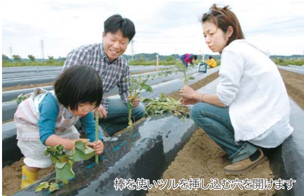
棒を使いツルを挿し込む穴を開けます

5月16日、島田体験農場でさつま芋の栽培体験を行いました。この日はツル挿し作業を実施。30センチメートル間隔に開けた穴に一本一本丁寧に植え付けます。昨年に引き続き参加した家族は「今年も友人を誘ってみんなで取りに来たいです」と収穫時を楽しみにしていました。その後、除草やツル刈りなどを行い、8月下旬から10月にかけて収穫をします。