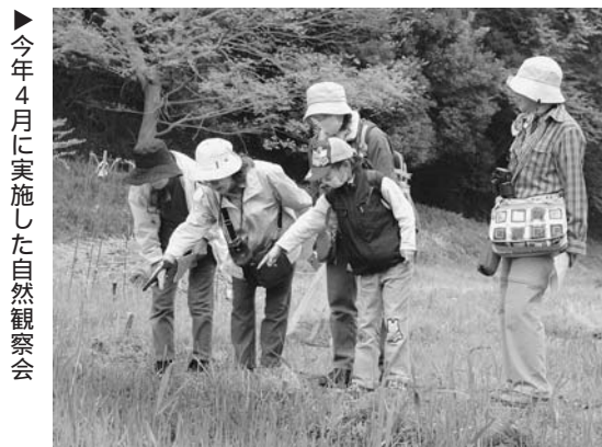
▶今年4月に実施した自然観察会