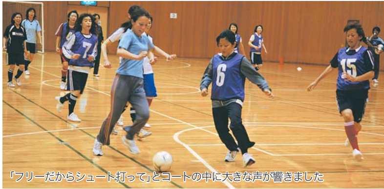
「フリーだからシュート打って」とコートの中に大きな声が響きました

市民体育館で女性フットサル教室が行われました。この教室は全4回で、5月8日の初回は、パスやシュートなどの基本的な練習とゲーム練習を実施。今回初めてフットサルを体験した受講者は「夫と子どもがサッカーを始めたので、私も何かスポーツをしようと思い参加しました。予想以上に激しい動きで驚いていますが、子どもに教えられるくらい上手になりたいです」と意気込みを話してくれました。