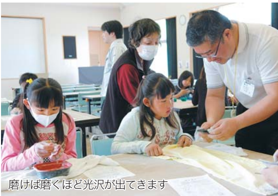
磨けば磨くほど光沢が出てきます

郷土博物館で勾玉作り体験講座が5月3日に行われました。勾玉は翡翠や瑪瑙を加工して作られた古墳時代によく見られる装身具で、一説にはおなかの赤ちゃんを表す形と言われています。今回は翡翠の色によく似た青田石を使用。手回しドリルを使った穴開け作業は大人でも一苦労で、中には30分以上格闘している子どももいました。仕上げに水やすりで磨くころには、それぞれの石に模様の違いが出てきます。作業を終えた子は「石が硬くて腕が疲れたけれどきれいにできたよ」と完成した勾玉を首にかけながら喜んでいました。