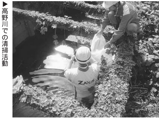
▶高野川での清掃活動

市では、事業所へのばい煙排出基準の確認立入調査や、大気の常時監視などを通して、大気汚染の未然防止に努めています。大気汚染は、