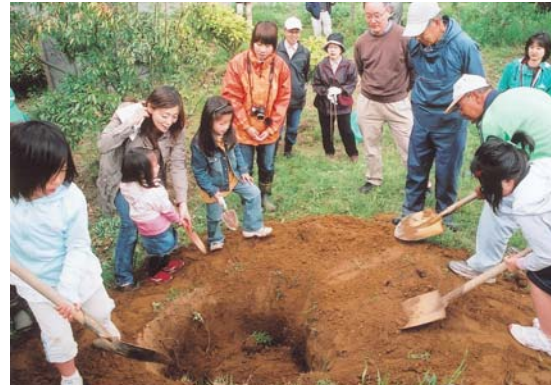
▲メッセージカードの入ったカプセルを埋める子どもたち

ほたるの里で5月10日、10年後の自分や家族にあてたメッセージカードをカプセルに入れ、埋める催しが行われました。これは“同所のPRと、環境維持活動に関心を持ってもらおう”と、八千代市ほたるの里づくり実行委員会が開いたもので、一般参加の市民や同会会員など約25人が参加。将来の夢や目標などが書かれたカード、680枚を埋めました。