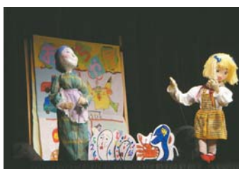
▶ 昨年の人形劇まつり

人形劇まつり 市内の人形劇サークルが、影絵や腹話術・人形劇を披露します。 日時 6月22日(日)午前10時30分・午後1時30分、場所 八千代台文化センター 入場無料。定員分の入場整理券を6月1日(日)から市民会館、八千代台・勝田台文化センター、総合生涯学習プラザ、公民館、教育委員会庁舎内文化スポーツ課で配布。(文化・スポーツ課)