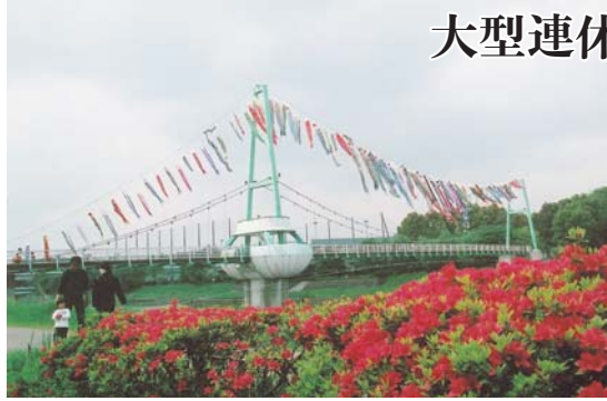
▲鯉のぼりは、毎年市少年野球連盟の監督やコーチなどの手により、揚げられています

4月29日から5月10日まで、新川ゆらゆら橋に鯉のぼりが揚げられました。この鯉のぼりは、八千代ふるさと親子祭実行委員会が“子どもが大きくなり、何年も物置や押し入れに眠ったまま使われなくなった物を再び空に帰そう”と、広報などを通じて市民に寄贈を呼びかけ集めたもの。今年は、約80匹の鯉のぼりが、川幅いっぱい泳ぎました。家族で見に来ていた人は「毎年、見に来ています。青空だったらよかったのに、今日はちょっと残念ですね」と話していました。