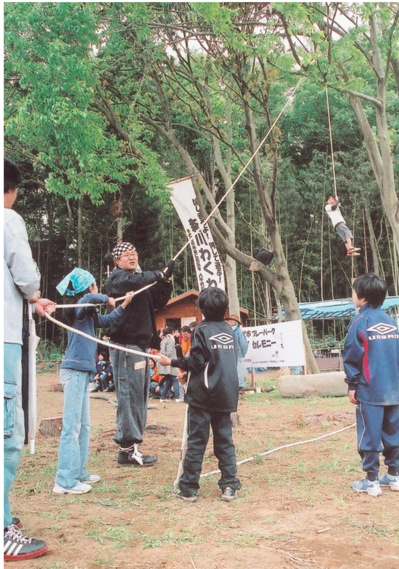
▲「引っぱってー」の声に「せーの」の掛け声とともに、ロープを引く人たち