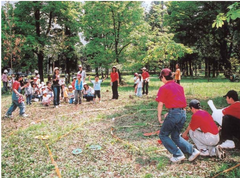
▲地面に引かれた的に向かって、インテリアカのボールを投げる「羽投げちやえ」のコーナー