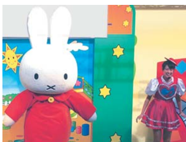
▲ミッフィーちゃんが来ます

6月8日(日) 8020歯つぴいやちよ2008を開催 今年も、8020歯つぴいやちよを開催します。フッ化物洗口体験や、歯ブラシ・石こう人形のプレゼントもありです。参加無料。 日時 6月8日(日)午前10時～午後3時30分 会場 フルルガーデン八千代 内容 ステージイベント「ミッフィーとつたおつ」(午前10時30分～午後1時) 表彰式(正午) スペシャルライブ(午後2時30分) 【「コーナイイベント」】お口の相談、フッ化物洗口体験、石こう人形プレゼント、お薬相談ほか 市歯科医師会(485) 7535