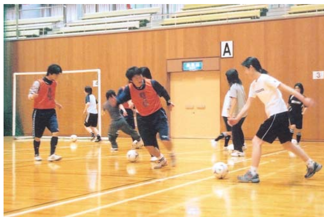
▲ドリブルの練習をする参加者