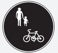
歩道通行可の標識