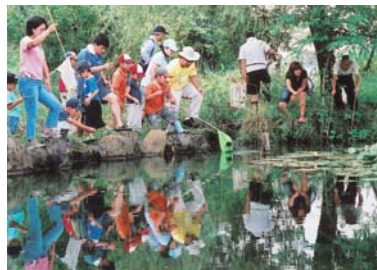
▲約1時間30分で、130匹程のザリガニを釣りました

「八千代には、まだ、こんなにたくさんの水生生物が住んでいる所があるんですね。」8月30日、米本にある“わたるの里”でザリガニ釣り大会が行われました。この催しは“ホタルの幼虫保護や同所の環境保全のため”わたるの里づくり実行委員会が開いたもので、17組の親子が参加しました。