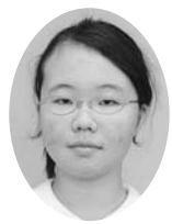
佐藤七海議員(萱田小) フリー

国道296号沿いに作っている道路は「八千代都市計画道路3・4・1号新木戸上高野原線」といいます。市内では延長7.3キロメートルが計画され、この内約4キロメートルの整備が完了しています。現在、県道船橋・印西線から東へ約1キロメートルの区間を整備しており、数年後の完成を目指しています。その後、上高野原地区の整備に入る予定です。この道路の歩道も幅を広くして、自転車も通れるよう計画しています。