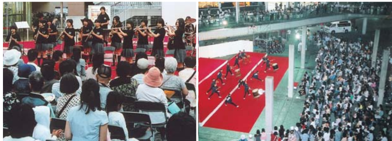
▲萱田中学校吹奏楽部の演奏の様子。演奏が終わると、会場からは大きな拍手が起きていました