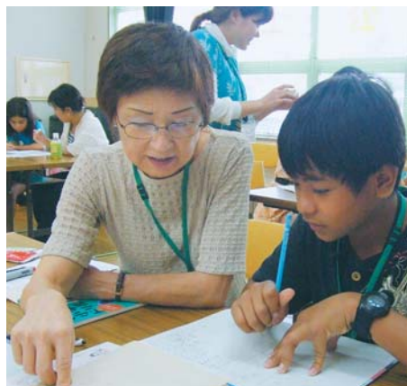
▲日本語を教わる参加者

8月26日から28日まで村上公民館で、サバイバル日本語講座が行われました。この講座は“在住外国人の子どもたちに日本の生活に慣れてもらおう”と、市国際交流協会が中心となって実施したものです。2回目となる今回は、ブラジルやフィリピン、中国などの子どもたち14人が参加。日本語の学習だけでなく、子ども会の八千代リーダーズクラブと一緒に万華鏡作りやレクリエーションゲームなどをして、楽しみました。夏休みの宿題のやり方を教えてもらった子は「読書感想文が書けて良かった」と話していました。