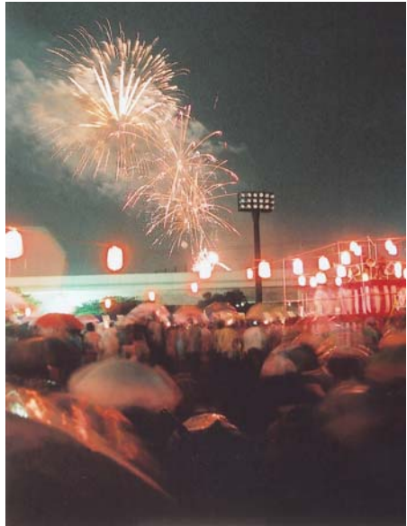
▲かさをさしながら、花火を見る人たち

8月23日、総合運動公園多目的広場周辺を会場に、八千代ふるさと親子祭が行われました。会場では、商業者や福祉団体などが品物を販売したほか、みこしの練り歩き、日本太鼓・舞踊パレード、約5,000発の花火の打ち上げなどが行われました。また、市民体育館では、環境をテーマにした“ECOカーニバルinやちよ2008”が行われ、ソーラーカーや各種エコ製品が展示されていました。