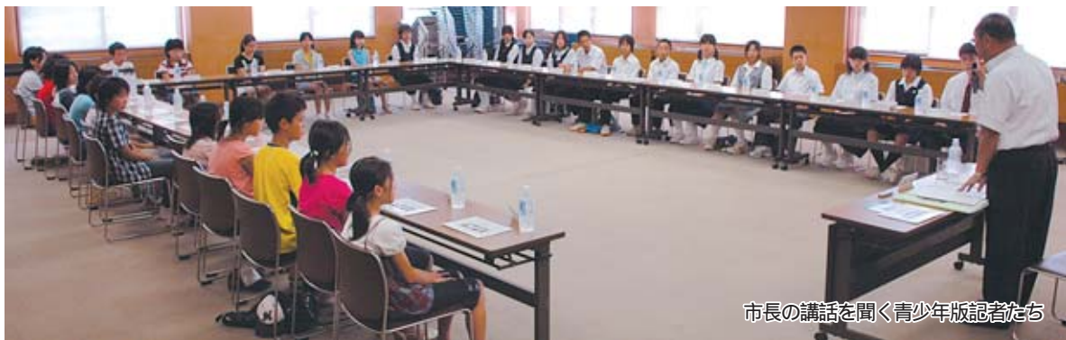
市長の講話を聞く青少年版記者たち