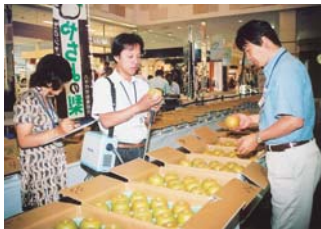
▲糖度を測る県農林振興センターの人たち