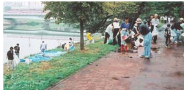
▲新川周辺を清掃する市民ボランティアの人たち。土手には、たくさんの敷物が放置されていました

8月23日、総合運動公園多目的広場周辺を会場に、八千代ふるさと親子祭が行われました。会場では、商業者や福祉団体などが品物を販売したほか、みこしの練り歩き、日本太鼓・舞踊パレード、約5,000発の花火の打ち上げなどが行われました。また、市民体育館では、環境をテーマにした“ECOカーニバルinやちよ2008”が行われ、ソーラーカーや各種エコ製品が展示されていました。