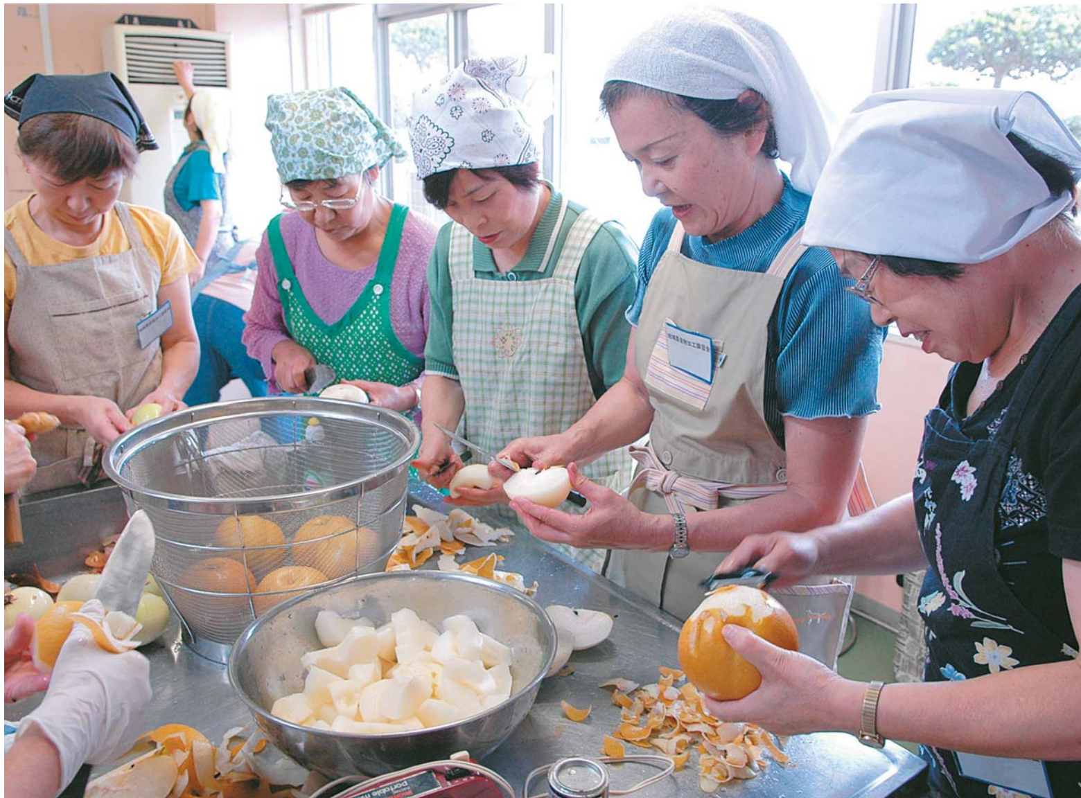
▲「梨入り焼肉のたれ」の下ごしらえをする参加者。今回は「豊水」を使用しましたが、「新高」でもおいしく作れます

地元で収穫された安全・安心な農産物を家庭料理に活用してもらおうと、9月18日、農業研修センターで「地域農産物活用加工講習会」が行われました。今回作ったのは「梨入り焼肉のたれ」と「米粉のシフォンケーキ」。梨などメインの材料は、市内や近隣でとれた物です。米粉は、近年の製粉技術の向上によって粒子の細かい物が作れるようになり、パンや麺類などの原料としても注目を集めています。「食の安全」が脅かされている現在の日本。食料自給率の低さも大きな問題になっています。地元産の農産物を見直し、上手に使って、食卓を豊かにしていきませんか。 ※8ページで作り方を紹介