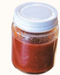
▲1か月ほど熟成させる

熱湯消毒した瓶に詰め、20分間加熱殺菌する。風通しの良い冷暗所(冷蔵庫以外)に1か月程度置く。時々瓶をゆする。 【ワンポイント】・完熟した梨を使うとよりおいしくできます。 ・ドレッシングとしてサラダなどにかけてもおいしいですよ。