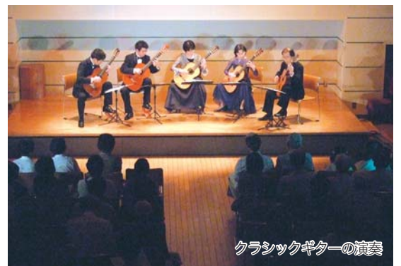
クラシックギター演奏

170度に温めたオーブンで40～45分焼く。10分ほど焼いたら、表面に切れ込みを入れる。きれいな焼き上がりになるように逆さまにして荒熱を取る。瓶などを利用すると便利。 【ワンポイント】・グラニュー糖を三温糖に変えてもおいしい。