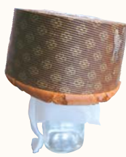
▲逆さまにして冷ます

【作り方】 卵を、卵白と卵黄に分ける。卵白はしっかりと泡立て、グラニュー糖を3回に分けて加える。卵黄は、白っぽくなるまでかき混ぜ、牛乳、サラダ油を加えて更に混ぜる。米粉をふるい入れ、よく混ぜる。更に泡立てた卵白を2回に分けて加えて混ぜる。シフォン型に を流し入れる。