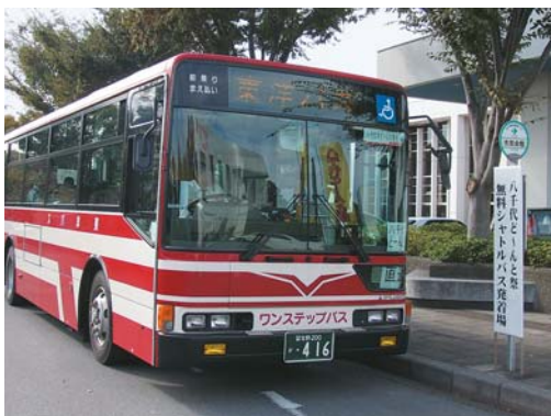
▲市民会館前と八千代台駅を結ぶシャトルバス。一日6本運行されました