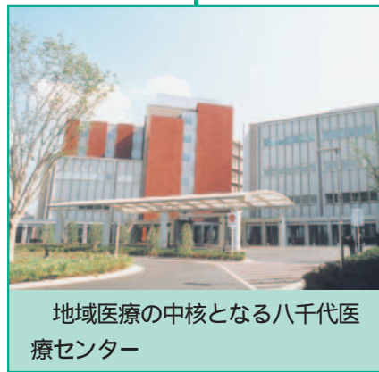
地域医療の中核となる八千代医療センター