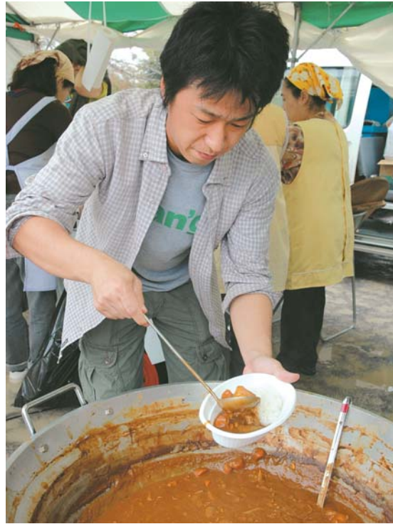
▲八千代産のお米、ジャガイモ、ニンジンを使ったカレー。市農業士等協会の皆さんが作りしました