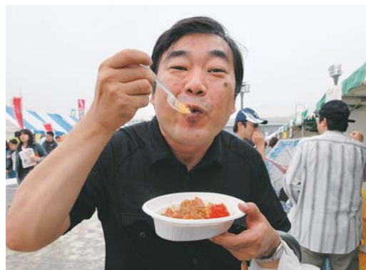
▲市農業士等協会のカレーをほおぼり「うん、うまい！」と満面の笑み

10月11・12日の二日間、総合運動公園多目的広場で「八千代どーんと祭」が開催されました。8回目となる今年の祭のテーマは二つ。一つ目は、昨年に引き続き「エコ」。会場内にごみを分別して回収する「エコステーション」を設置し、祭の名物「大鍋豚汁」では、洗って繰り返し使えるリユース食器を採用しました。