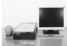
▲音声・拡大読書機