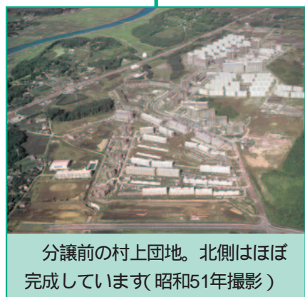
分譲前の村上団地。北側はほぼ完成しています(昭和51年撮影)