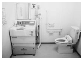
▲オストメイト対応型トイレ