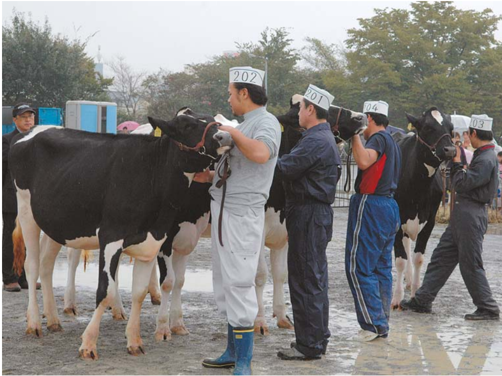
▲11日に行われた乳牛の共進会。市内で飼育された乳牛(ホルスタイン)の代表18頭が出品されました