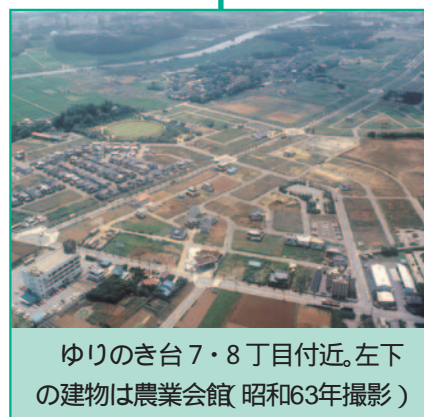
ゆりのき台7・8丁目付近。左下の建物は農業会館(昭和63年撮影)