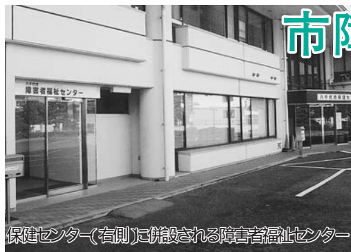
保健センター(右側)に併設される障害者福祉センター

11月11日(火)、保健センターに併設された“八千代市障害者福祉センター”がオープンします。ここでは、同施設の概要と設備について、紹介します。