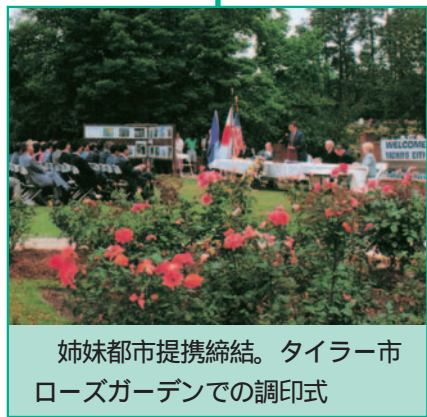
姉妹都市提携締結。タイラー市ローズガーデンでの調印式