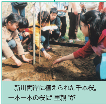
新川両岸に植えられた千本桜。一本一本の桜に「里親」が