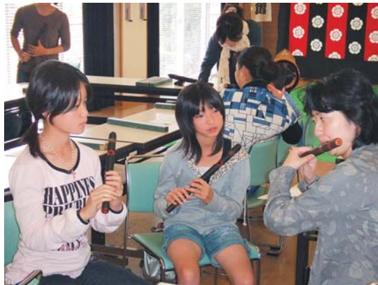
龍笛の練習。指導は上野雅楽会の皆さん