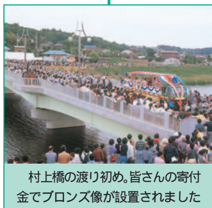
村上橋の渡り初め。皆さんの寄付金でブロンズ像が設置されました