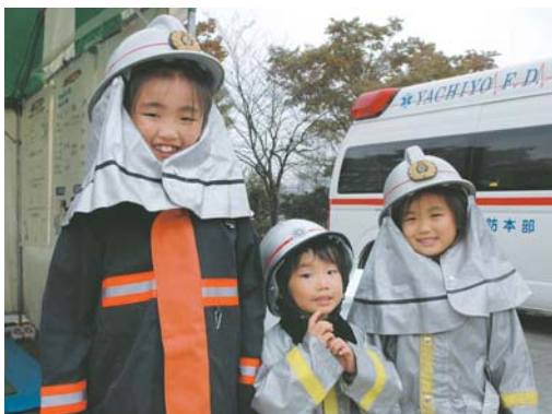
▲市消防本部のブース(11日)。子ども用の防火服を着て記念撮影。このほか救命講習も行われました