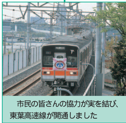
市民の皆さんの協力が実を結び、東葉高速線が開通しました