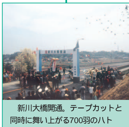
新川大橋開通。テープカットと同時に舞い上がる700羽のハト