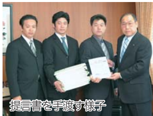
提言書を手渡す様子

社団法人八千代青年会議所は震災対策について市民アンケートを実施し、「安心・安全なまちづくりに向けての提言書」をまとめました。この提言書は12月16日、八千代市長に手渡されました。