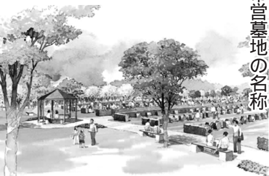
墓地敷地内のイメージイラスト

(仮称)八千代市営墓地は、22年度の供用開始に向け、市北部の小池地区に建設を進めています。敷地内は、明るく開放的なイメージで設計されており、公園のように休憩したり散策することができま。また、周辺には神崎川が流れ、緑豊かな環境が広がっています。今回、この墓地の名称を募集します。応募できるのは市内在住・在勤または在学の人です。