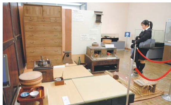
◀十間のある台所を再現

郷土博物館では現在、企画展「いつかどこかで見た暮らし～農家編～」を開催中です。これは「昔の暮らしの様子を知りたい」「昔の道具を見たい」という要望が多かったことから企画されたもの。昭和初期の台所や、昭和30年代の茶の間が再現されています。ほかにも炭火アイロンや火鉢など約100点を展示。これらはすべて市内で実際に使われていた物です。企画展は月曜日、祝日を除き3月1日(日)まで行っています。