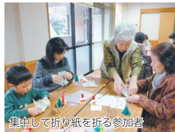
集中して折り紙を折る参加者

「折り紙って折り方を見てもうまく折れないんですよ。ここでは講師の皆さんがすぐそばで教えてくれるので分かりやすいし、子どももいろいろな人から教えてもらえるのでとても楽しみにしています。」と参加者は話していました。