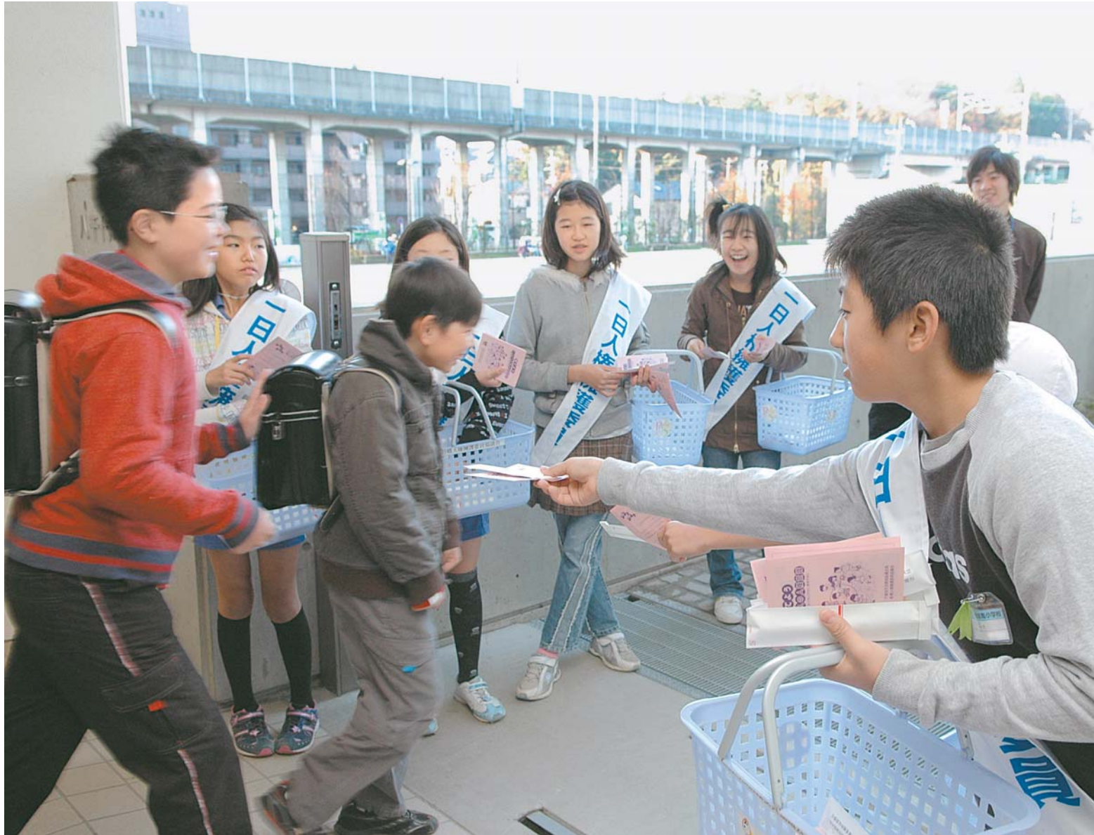
▲「おはよう」と元気にあいさつしながらパンフレットと鉛筆を配る児童たち

萱田南小学校の児童会代表委員10人が「一日人権擁護委員」に委嘱されました。人権思想の礎となる、“相手を思いやる心の大切さ”について考える切っ掛けにしてもらおうと、船橋人権擁護委員協議会が行ったものです。 「一日人権擁護委員」に委嘱された10人は、12月11日の午前7時から8時までの1時間、登校中の児童に友達の大切さについて書かれたパンフレットと鉛筆を配りました。パンフレットを配り終えた児童は「いじめも人権問題のひとつだということを今回初めて知りました。いじめは絶対いけないこと。もし見掛けたら勇気を出して注意したいと思います」と力強く語ってくれました。