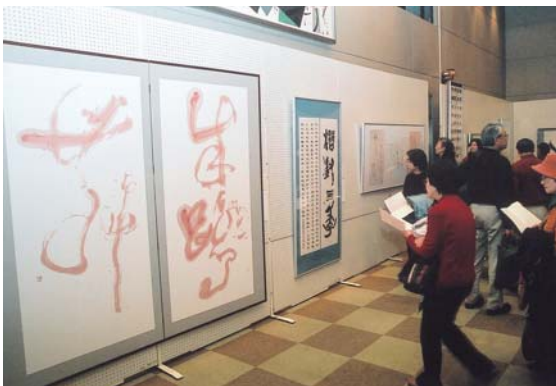
▲作品を見る人たち。3日間で6,500人が来場しました