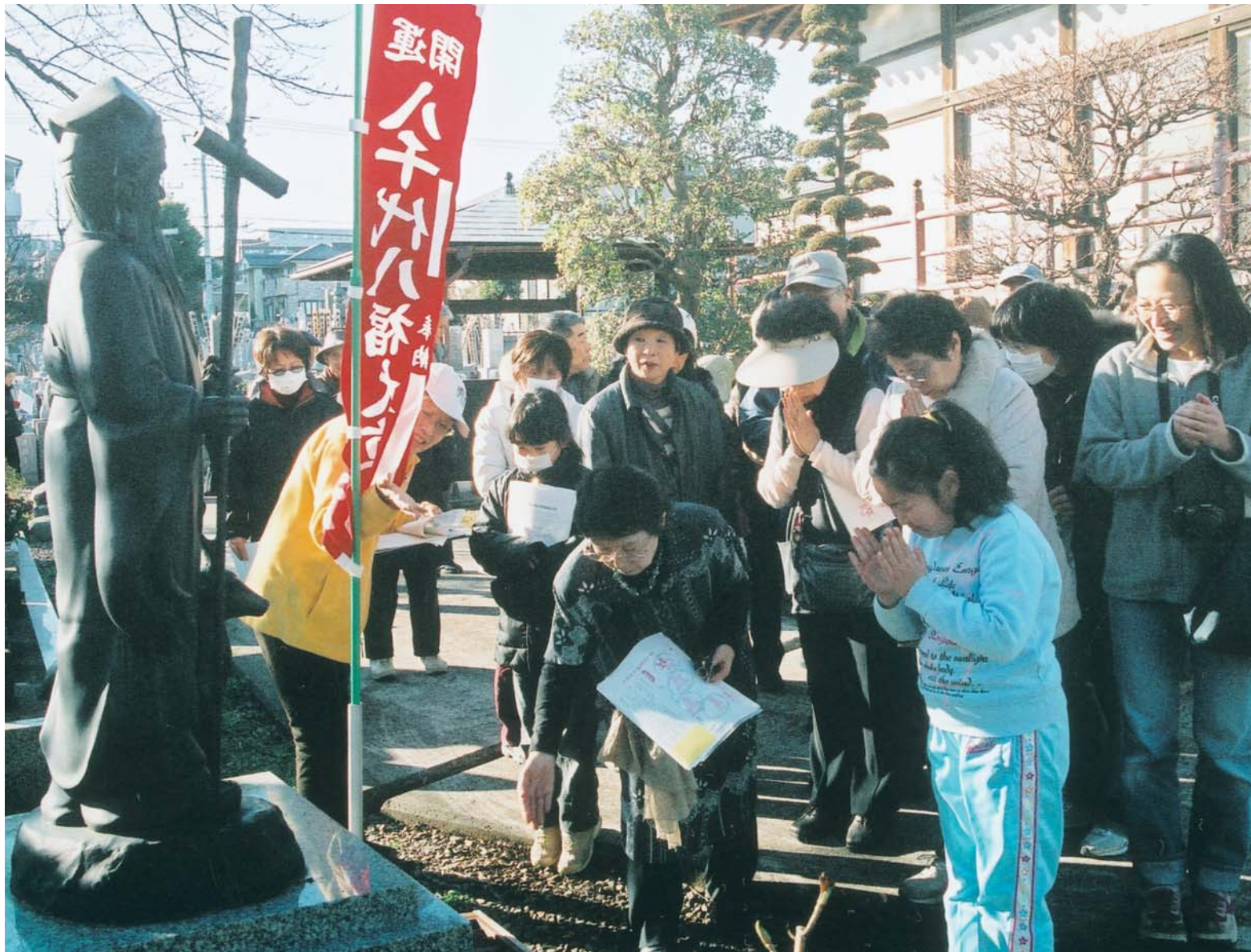
▲萱田の長福寺に設置されている“寿老人”に手を合わせる参加者。寿老人は、長寿の象徴です

「七福神は、いろいろな所にあります。八福神は珍しいですね。それも市内にあるなんて知りませんでした。1月25日、“バスで巡る初詣やちよ八福神と郷土博物館”が行われました。これは“末広がりで縁起の良い八福神を巡りながら、郷土の歴史を知ってもらおう”と、八千代市レクリエーション協会が毎年開いているもので、41人が参加。今回は、郷土博物館の見学もコースに入られました。車内で同協会の担当者から八福神設置の由来や寺院にまつわる伝説などについて聞いた参加者は、それぞれの寺院で手を合わせたり、持参した色紙に朱印を押したりしていました。