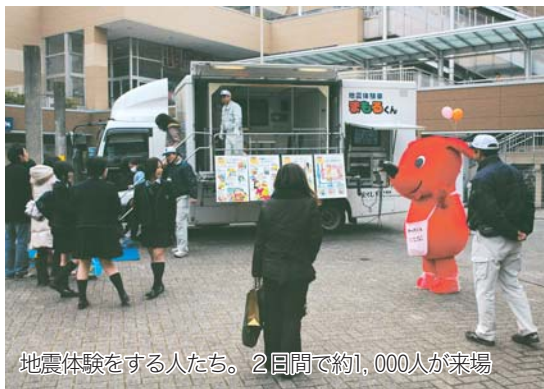
地震体験をする人たち。2日間で約1,000人が来場

1月17日、フルルガーデン八千代で、18日、八千代緑が丘駅南口駅前広場で、防災フェアが開かれました。これは、7年1月17日に発生した阪神・淡路大震災をきっかけに制定された“防災とボランティア週間”に合わせて、市総合防災課が開催したものです。会場には地震体験車が置かれ、長い列ができていました。阪神・淡路大震災と新潟中越地震の揺れを疑似体験したという人は「今まで、揺れ方に大きな違いは無いかと思っていました。発生した地震によって、こんなに揺れ方が違うんですね。驚きました」と話していました。