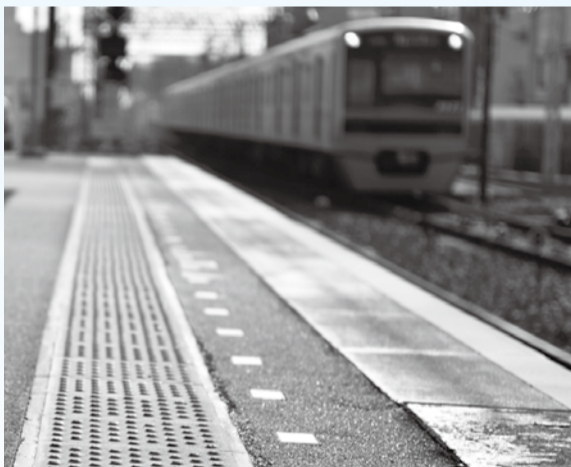
▲改修後はより安全に歩きやすくなります

教育内容の充実として、第3期教育振興基本計画に対応したICT環境整備を行います。