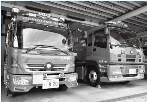
▲市民の安全を守る拠点として整備を行います

消防に関する施策としては、老朽化が進む東消防署の移転、庁舎や訓練施設などを整備します。