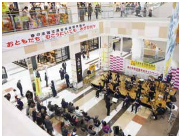
▲昨年の八千代東高校による吹奏楽の演奏

▶日時 4月7日(土)午後1時30分～3時 ▶場所 イオンモール八千代緑が丘アゼリア広場（生活安全課・八千代警察署交通課）