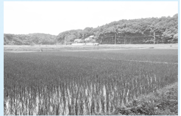
▲生産性向上のため調査・設計などの補助を行います

また、地域公共交通網形成計画策定のため、交通不便地域に住む市民の生活移動手段などの調査を行うとともに、住宅に関する施策として、