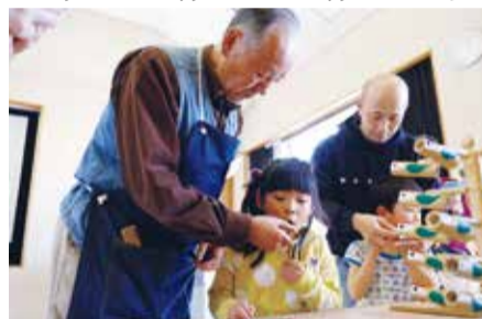
▲講師に教わりながら竹笛を作りました

できあがったら作品を手に中庭へ。青空の下で、大人も、子どもも時間を忘れて夢中になって遊んでいました。