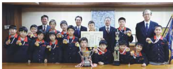
▲2月20日、市長に優勝報告するメンバーの皆さん

「村上イーグレッツボーイズが第42回千葉県ミニバスケットボール大会で、5年ぶり6回目の優勝を果たし、全国大会への出場を決めました。予選となった県大会は4日間の日程で行われ、初日は一日で3試合をこなす厳しいスケジュールでしたが、7試合全てに勝利。県内193チームの頂点に立ちました。市長への優勝報告で「全国大会では、