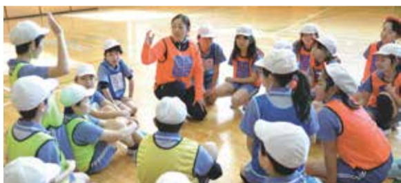
▲大島さんとミニゲームの作戦を練る子どもたち

「八千代市民等46名の『ユメセン（夢先生）』支援隊」の皆さんの寄附により、日本サッカー協会が主催する「夢の教室」が行われました。この授業は、現役、OBOGのスポーツ選手が学校へ訪れ、夢に向かって努力することや、仲間と協力することの大切さなどを子どもたちに伝えるものです。2月19日には、萱田南小学校に、陸上の長