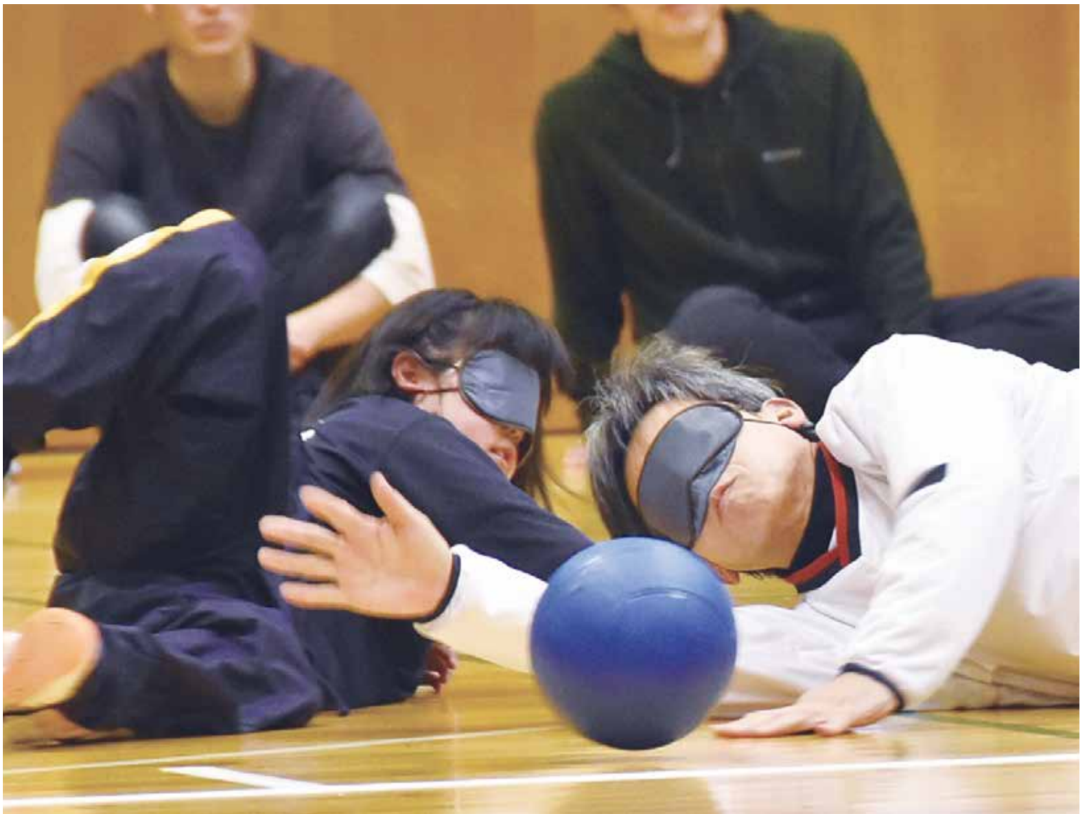
▲ゴールボールは3人1組で行う競技。千葉県スポーツ少年団地域交流大会として開催された体験会に約100人の子どもが参加

「障害者差別解消法」が施行されて2年。さまざまな障害者スポーツがテレビや新聞などで紹介されるようになり、興味を持つ人も増えてきました。