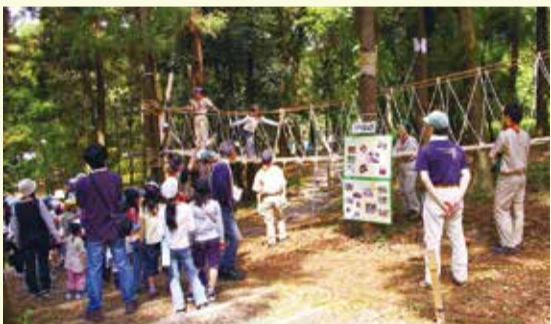
▲ボーイスカウトのダイナミックなアスレチックが人気です

アスレチックやクラフト体験コーナーなど。市内在住の3歳以上の人を対象です（小学2年生以下は保護者同伴）。昼食、飲み物、筆記用具、帽子持参(雨天時は上履きも)。動きやすい服装で参加してください。事前の申し込みは不要です。当日直接会場へ。駐車場はありませんので、公共交通機関を利用してください。